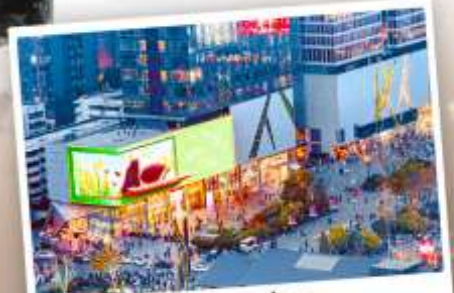
ถนนไท่กู๋หลี่หลิน