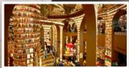
ร้านหนังสือจงซูเก๋