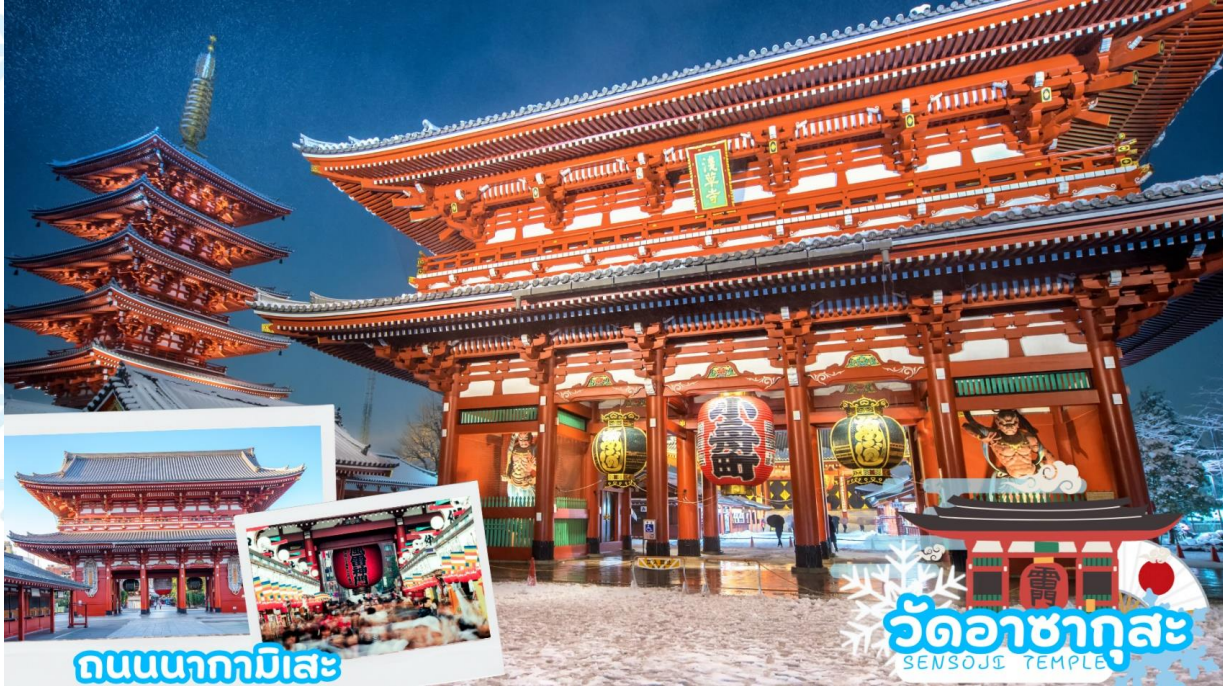
ถนนนากามิसे