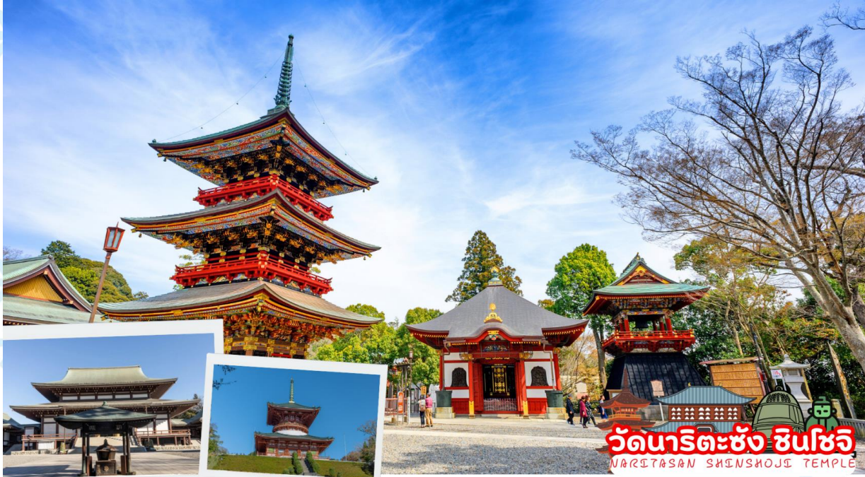
วัดนาริตะซัง ชินโซจิ NARITASAN SHINSHOJI TEMPLE

เดินทางสู่ วัดนาริตะซัง ชินโซจิ (Naritasan Shinshoji Temple) มีประวัติศาสตร์อันเก่าแก่ มีอายุยาวนานมากกว่า 1,000 ปี (สมัยเฮอัน ช่วงปลายศตวรรษที่ 8) ซึ่งเป็น 1 ใน 3 วัดหลักของลัทธิคันโตที่ได้สร้างขึ้นอุทิศแด่ศาสนาพุทธให้กับเทพเจ้าฟูคูเมียวโอะ วัดนี้ถือได้ว่าเป็นวัดที่ศักดิ์สิทธิ์มากทางด้านการขอพรเรื่องความปลอดภัย แคล้วคลาดจากภัยอันตรายและอุบัติเหตุต่าง ๆ รวมทั้งเรื่องความรัก หน้าที่ การงาน