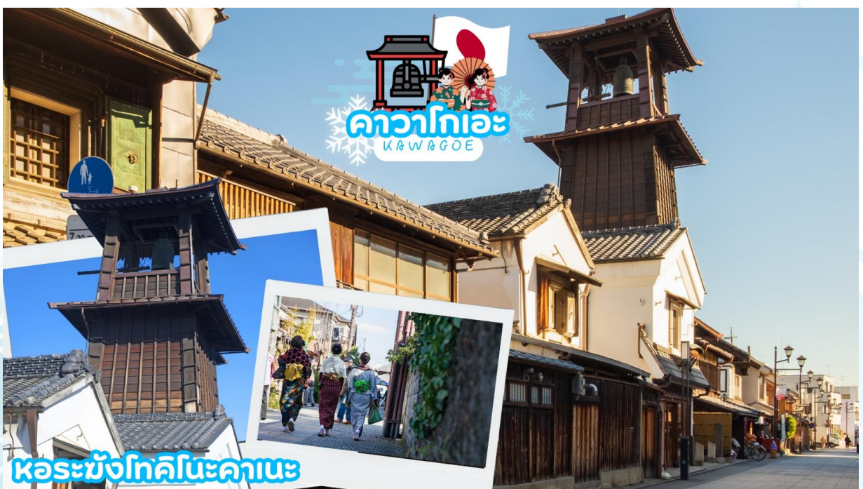
หอระฆังโทคิโนะคานะ

เดินทางสู่ คาวาโกเอะ (Kawagoe) ได้รับการขนานนามว่าเป็นลิตเติลเอโดะ เพราะมีบรรยากาศที่มีความเป็นเมืองเก่าที่ได้กลิ่นอายโบราณทำให้รู้สึกเหมือนได้ย้อนยุค ได้สัมผัสบรรยากาศของโกดังเก่า ที่เรียงรายกันยาวตลอดระยะทางกว่า 700 เมตร ในสมัยก่อนเป็นสถานที่เก็บกักเสบียงอาหารเพื่อส่งไปให้เมืองเอโดะ (โตเกียวในปัจจุบัน) แต่ในปัจจุบันได้ถูกเปลี่ยนเป็นร้านค้า ร้านอาหาร ร้านขายของที่ระลึก ไม่ว่าจะเป็นร้านขนมที่ทำจากมันหวานสีเหลืองและสีม่วงอันเป็นผลิตภัณฑ์ขึ้นชื่อของเมืองนี้ สถานที่ท่องเที่ยวอันมีชื่อเสียงของเมืองคาวาโกเอะ