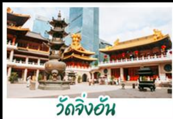
วัดจิ้งอัน