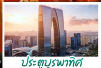
ประตูบูรพาทิศ