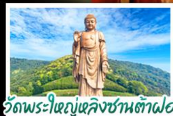
วัดพระใหญ่เฉิงชานต้าฝอ