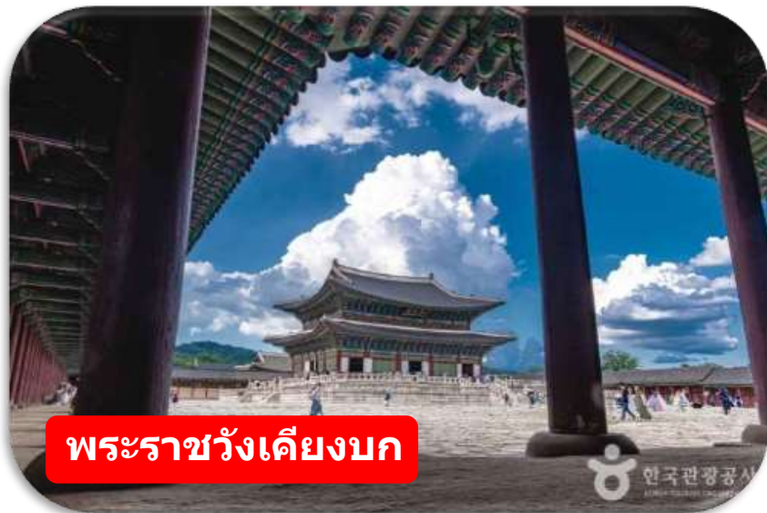
พระราชวังเคียงบก

พระราชวังเคียงบก (Gyeongbokgung) ไม่รวมค่าเช่าชุดฮันบก พระราชวังหลวงที่ยิ่งใหญ่ที่สุดของเกาหลี ท่านสามารถเดินถ่ายรูปภายในพระราชวัง ท่ามกลางสถาปัตยกรรมโบราณอันงดงาม ไม่ว่าจะเป็ห้องพระโรง ศาลาริมสระน้ำ และฉากภูเขาด้านหลังที่สวยงาม พร้อมทั้งเข้าชมพิพิธภัณฑ์พื้นบ้านเกาหลี