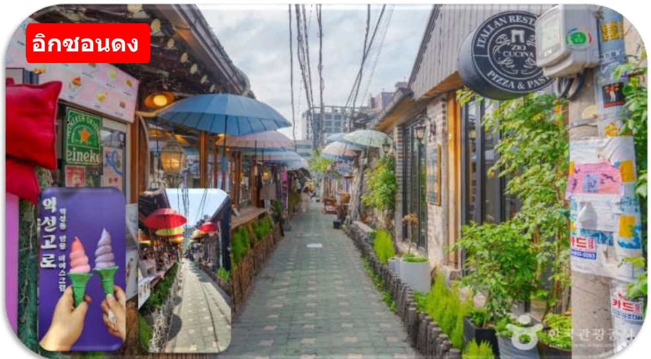
อิคซอนดง

รถไฟใต้ดินลงสถานี Jongno 3-ga (Line 1, 3, 5) แล้วเดินประมาณ 5 นาที