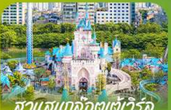
สวนสนุกโลกอิตาเลี่ยน Lotte Adventure World