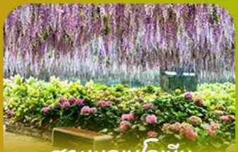
สวนนกบึงโกเบียว