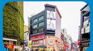
ช้อปปิ้งย่านมิมงดง