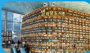
ห้องสมุดสตาร์ฟิลา