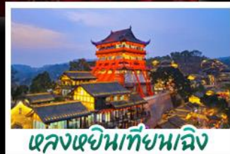
เจหลงเจินเทียนหลง