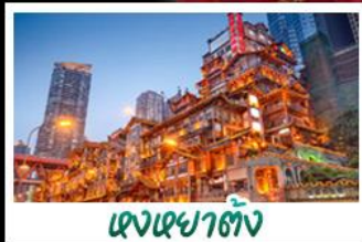
เจงเจาตัง