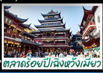
ตลาดร้อยปีฉางหวงเหมียว