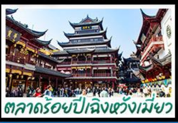
ตลาดร้อยปีเฉิงหวงเหมย

2UHGH-FD002 | 6วัน 5คืน | AirAsia | โรงแรม 4 ดาว