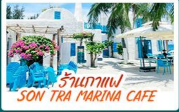
ร้านกาแฟ SON TRA MARINA CAFE