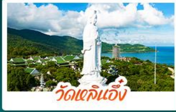
วัดเจลินเิ่ง