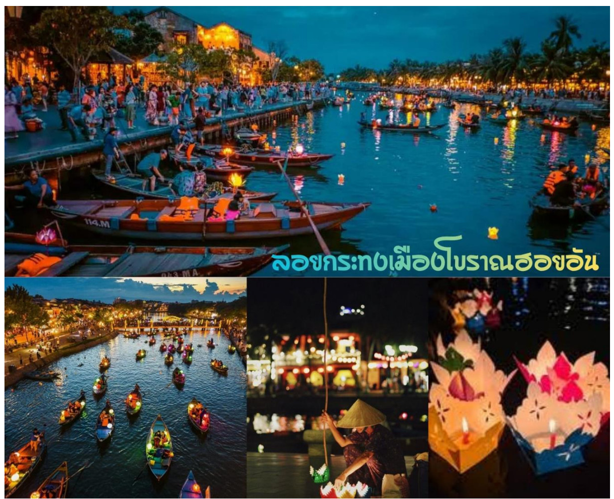
ล่องกระทงเมืองโบราณฮอยอัน

นำท่าน ล่องเรือลอยกระทง ในแม่น้ำหว่าย และเพลิดเพลินไปทิวทัศน์ของเมืองโบราณฮอยอันในยามค่ำคืน