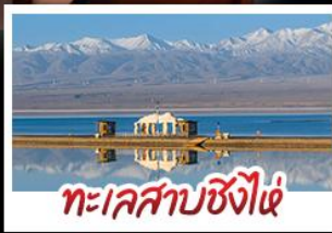
ทะเลสาบซีงไฉ่