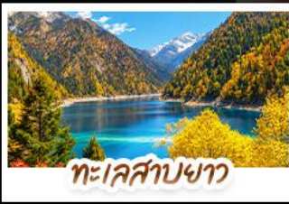
ทะเลสาบขาว