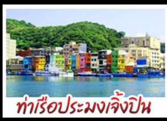
ทำเรือประมงเจิ้งปิ่น

รถไฟสายโบราณอาลีซาน - ตักไทเป 101 ประมงเจิ้งปิ่น - จิวเฟิ่น - ล่องเรือทะเลสาบสุริยันจันทรา ทานเมนูเด็ด เสวยหลงเป่า & ปลาประรานาธิบดี ช้อปปิ้ง 3 ย่านคัง : ซีหมิ่นตง - ไทจงไนท์มาร์เก็ต - MITSUI OUTLET