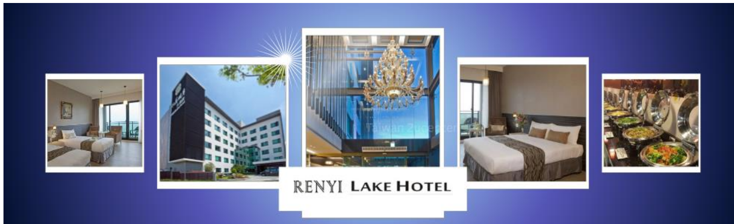
RENYI LAKE HOTEL

ค่าที่พัก รับประทานอาหารค่ำ ณ ภัตตาคาร โรงแรม REN YI LAKE HOTEL หรือเทียบเท่าระดับ 3-4★