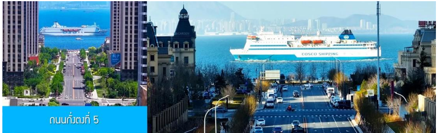
ถนนกิ่งตงที่ 5

หลังอาหารนำท่านเที่ยวชม ถนนกิ่งตงที่ 5 港东五街 จุดเช็คอินใหม่ที่ได้รับคามนิยอย่างสูงจากนักท่องเที่ยว และชาวเมืองต้าเหลียน จุดนี้เป็นช่วงที่ถนนสายกิ่งตงที่ห้า มุ่งตรงสู่ทะเล(มองจากจุดชมวิวที่อยู่ด้านบน) เสมือนว่าปลายทางของถนนไปสิ้นสุดในทะเล อีกด้านจะมองเห็นท่าเรือและอาคารสถาปัตยกรรมตะวันตกเป็นกรอบของมุกกล้องที่งดงาม เมื่อมีเรือแล่นมาผ่านทะเลตรงบริเวณนี้ จะเป็นภาพที่สวยงามและ โรแมนติก