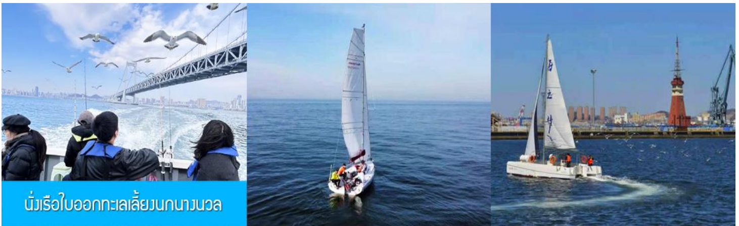
นั่งเรือใบออกทะเลลิ้นกนางนวล