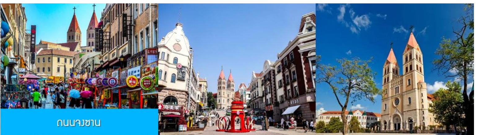
ถนนจงซาน