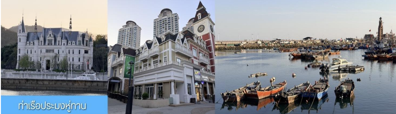
ท่าเรือประมงหู่ทาน

พักที่ DALIAN JUZISHUIJING HOTEL / SANSUI HOTEL โรงแรมระดับ 4 ดาวท้องถิ่น ต้าเหลียน