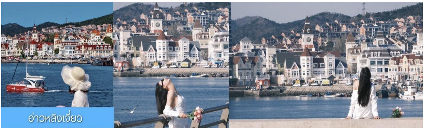
อ่าวหลังเจี้ยว

จากนั้นนำท่าน เที่ยวชม ท่าเรือประมงหู่ทาน 大连渔人码头 เป็นจุดเช็คอินที่โดดเด่นด้วยสถาปัตยกรรมสไตล์ยุโรปสีสันสดใส ผสมผสานกลิ่นอายเมืองท่าดั้งเดิมเข้ากับบรรยากาศสุดโรแมนติกที่เต็มไปด้วยเรือประมง คาเฟ่ ร้านอาหาร และจุดชมวิวยุริมาทะเล