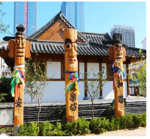
KOREAN TOWN หินล้อมีฟ้า