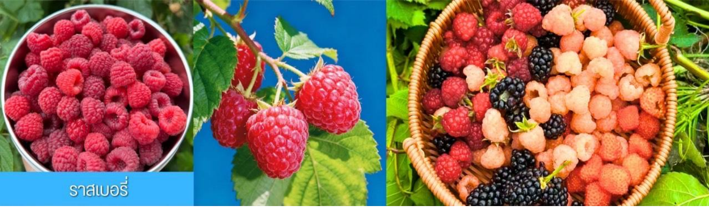
ราสเบอร์รี่