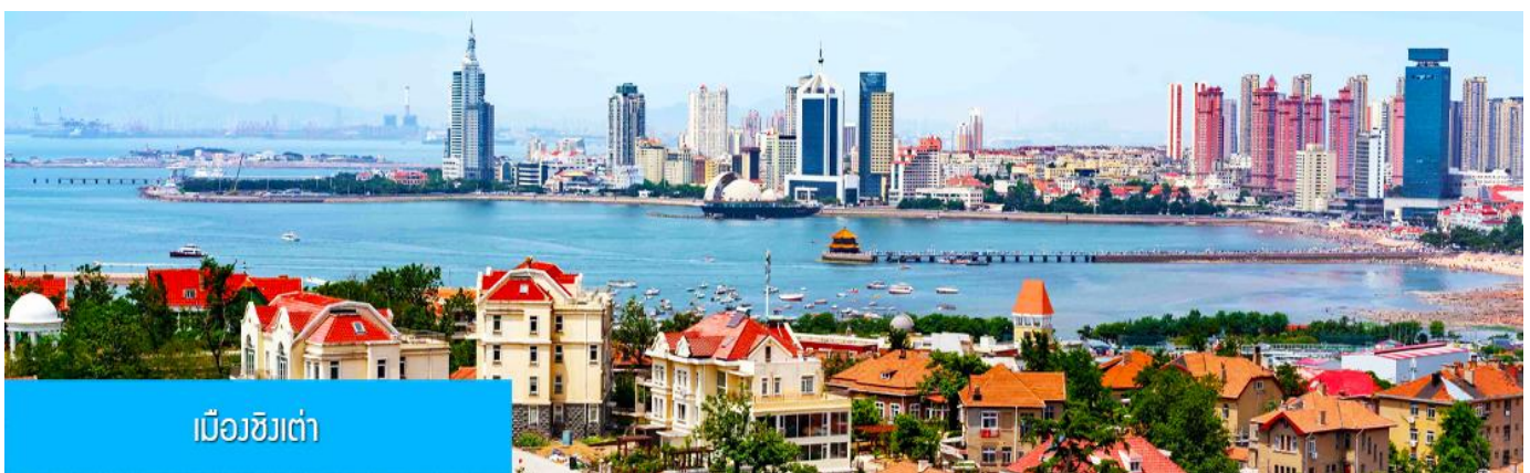
เมืองชิงเต่า