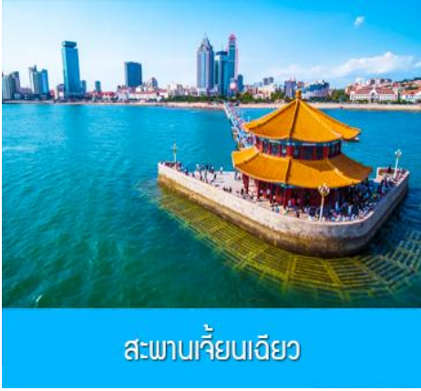
สะพานเจียวเบียว

หลังอาหารนำท่านสัมผัสมนต์เสน่ห์ของหมู่บ้านชาวประมง ซาจื่อโจว 沙子口渔村 ให้ท่านได้ชมวิถีชีวิตดั้งเดิมกับทิวทัศน์ชายทะเล วิถีบ้านเรือนหลากสีที่ตั้งเรียงรายตามแนวชายฝั่งที่โดดเด่นด้วยเอกลักษณ์ ทำให้ หมู่บ้านซาจื่อโจว เป็นเอกลักษณ์เป็นจุดถ่ายภาพราวกับเมืองชายฝั่งของอิตาลีในยุโรป, จึงเป็นที่ดึงดูดให้นักท่องเที่ยวต่างอยากมาสัมผัสบรรยากาศ ณ หมู่บ้านชาวประมงซาจื่อโจวแห่งนี้