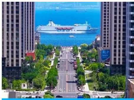
ถนนกว้างที่ 5

จากนั้นนำท่านเที่ยวชม สวนน้ำเมืองเวนิสตะวันออก 大连东方威尼斯城 เป็นเมืองเวนิสจำลองที่ถูกสร้างขึ้นด้วยทุนกว่า 8,000 ล้านบาท ออกแบบโดยบริษัท ARC จากประเทศฝรั่งเศส โดยจำลองผังเมืองเวนิสในประเทศอิตาลี บนพื้นที่กว่า 400,000 ตารางเมตร ประกอบด้วยคลองเวนิสและอาคารที่มีสถาปัตยกรรมแบบตะวันตกกว่า 200 หลัง มีบริการล่องเรือคอนโดล่าแก่นักท่องเที่ยว นำท่านเดินชม ถ่ายภาพที่ระลึกท่ามกลาง