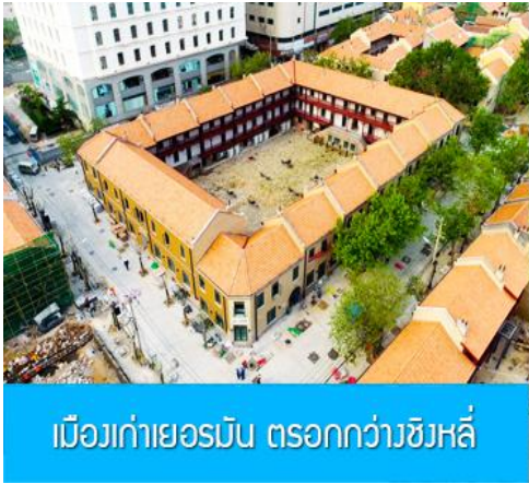
เมืองเก่าเยอรมัน ตรอกกว้างชิงลี่