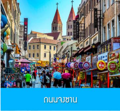
ถนนางซาน

นำท่านเดินทางชม สะพานจ้านเจียว 栈桥 เป็นแลนด์มาร์กแห่งประวัติศาสตร์คู่เมืองชิงเต่า สร้างเมื่อปี ค.ศ.1891 มีลักษณะเป็นสะพานหินทอดยาวกว่า 440 เมตรสู่ทะเล ปลายสะพานมีศาลา ทรงแปดเหลี่ยมสีแดงที่โดดเด่น ซึ่งเป็นสัญลักษณ์บนฉลากเบียร์ชิงเต่า ขึ้นชื่อเรื่องวิวสวย รับลมทะเล ให้ท่านเก็บภาพบรรยากาศ