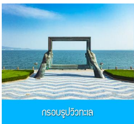
กรอบรูปวิวกทะเล