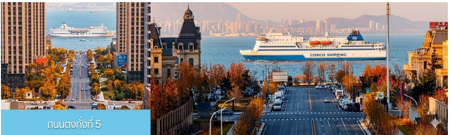
ถนนตงกังที่ 5