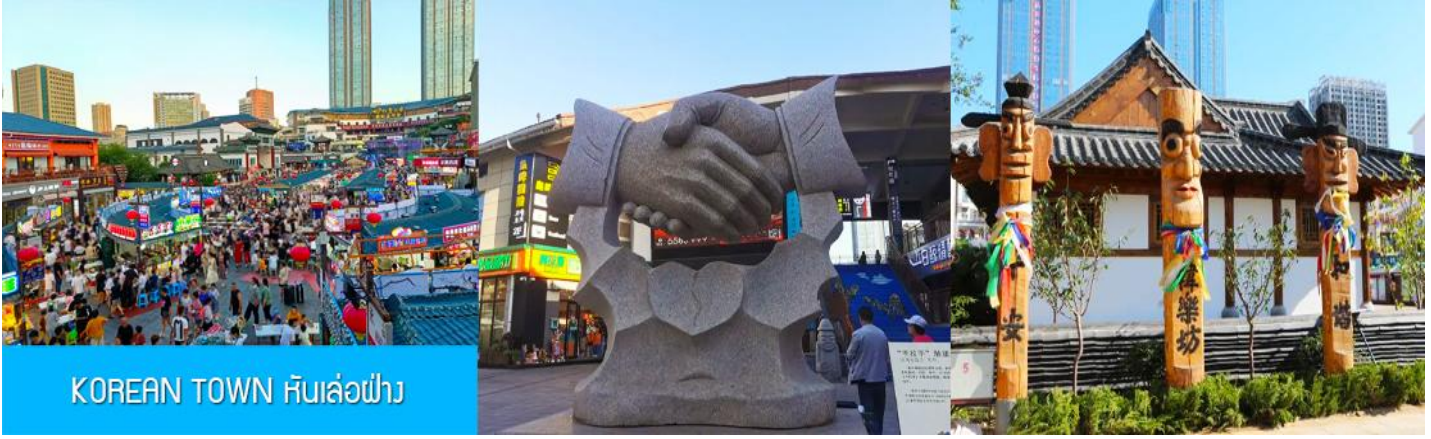
KOREAN TOWN หันล่อฟ้า

จากนั้นนำท่านสู่ ย่านเกาหลี KOREAN TOWN หันล่อฟ้า 韩乐坊 แหล่งท่องเที่ยวระดับ 3A ที่ชุกจนเซี่ย วัฒนธรรมเกาหลีของเมืองเวย์ไห่ ประกอบด้วยถนนคนเดินเกาหลี ประตุน้ำสี่คู่ หอเฉลิมฉลอง และจัตุรัส วัฒนธรรมเล่นเปียโนที่มีความโดดเด่นด้านสถาปัตยกรรม ให้ท่านได้เดินชม เก็บภาพ ลิ้มรสอาหารพื้นเมืองใน ย่านเกาหลีได้อย่างเต็มอิ่ม..