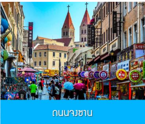
ถนนจงซาน