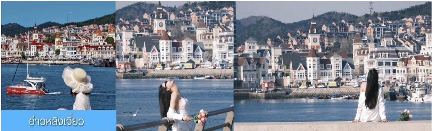
อ่าวหลังเจี้ยว

จากนั้นนำท่าน ทิวชม ท่าเรือประมงหู่ทาน 大连渔人码头 เป็นจุดเช็คอินที่โดดเด่นด้วยสถาปัตยกรรมสไตล์ยุโรปสีอันสดใส ผสมผสานกลิ่นอายเมืองท่าดั้งเดิมเข้ากับบรรยากาศสุดโรแมนติคที่เต็มไปด้วยเรือประมง คาเฟ่ ร้านอาหาร และจุดชมวิวยามทะเล