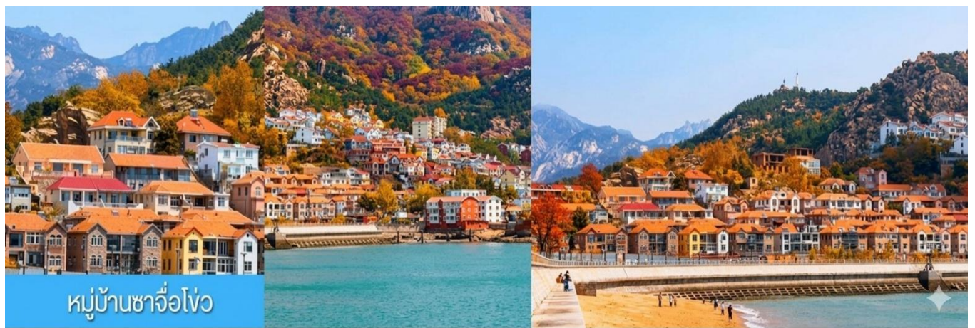
หมู่บ้านซาจื่อโ้ว

พักที่ WEIHAI BOYUE HOTEL / WEIHAI JIANGUO PUYIN โรงแรมระดับ 4 ดาวท้องถิ่นเมืองเวย์ไห่