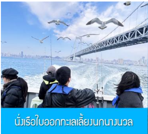
นั่งเรือใบออกทะเลลิ้นนกนางนวล