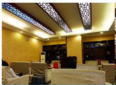
ศูนย์แพทย์แผนจีน

อัตราค่าบริการสำหรับโปรแกรมเสริมการแสดงชุด The love Story of Wooden man and Fairy Fox ท่านละ 400 หยวน (หรือประมาณ 2000.-บาทขึ้นอยู่กับอัตราแลกเปลี่ยน) ระยะเวลาที่ใช้ในการเที่ยวชมการแสดง ประมาณ 3 ชั่วโมง รวมเวลาเดินทางไปกลับค่าบริการรวม ค่าบัตรเข้าชม ค่ารถรับ ส่ง และค่าน้ำดื่มของไกด์ท้องถิ่น