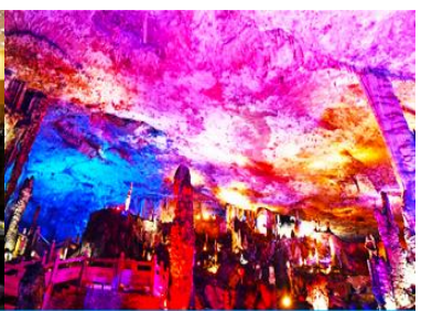
ถ้าเก่าสวรรค์จิวเทียนตั่ว

วันที่สาม เมืองจางเจียเจีย-ศูนย์แพทย์แผนจีน -ศูนย์จำหน่ายผลิตภัณฑ์ยางพารา-ถ้าเก่าสวรรค์-อุทยานฟงเลี่ยนซี-ล่องเรือธารน้ำหมาเหียนเหอ-เมืองโบราณฝูหรงเงิน