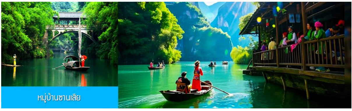
หมู่บ้านชาเลีย