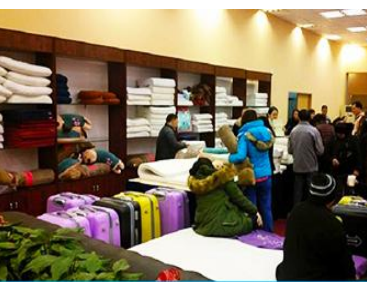
ศูนย์จำหน่ายผลิตภัณฑ์ยางพารา