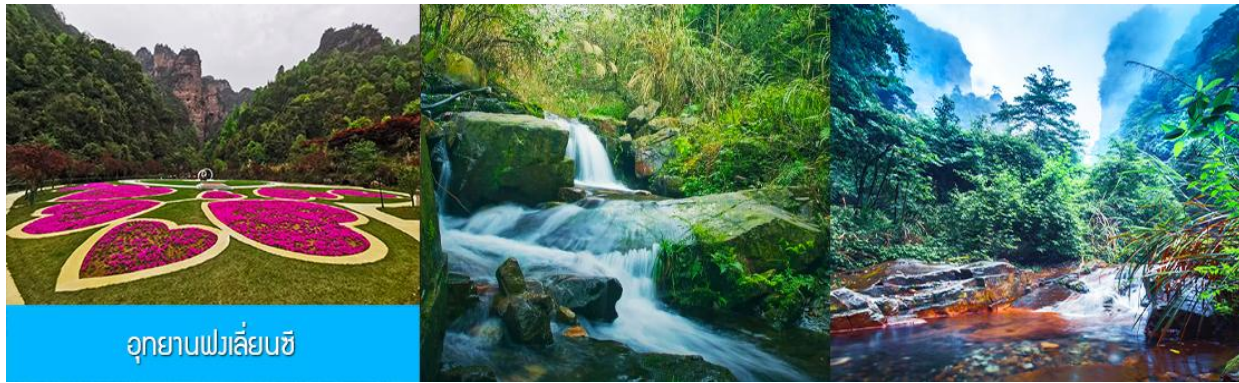
อุทยานฟงเลี่ยนซี