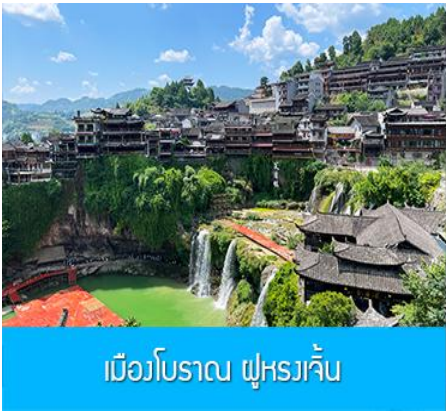
เมืองโบราณ ฟูหรงจิ้น