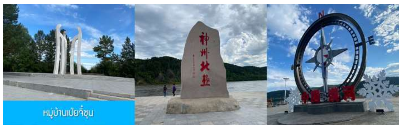
หมู่บ้านเป่ย์จื๋น

เที่ยง รับประทานอาหารกลางวัน ณ ร้านอาหารระหว่างทาง (20)