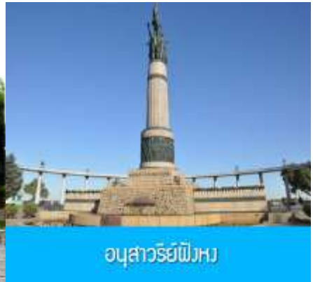
อนุสาวรีย์พิงหว