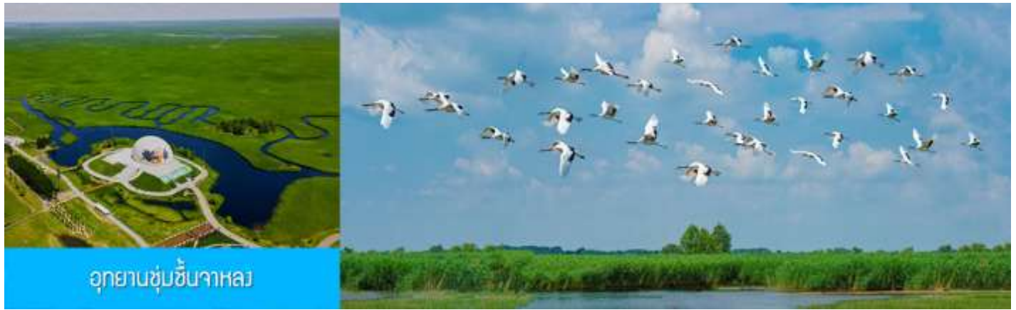
อุทยานชุ่มชื้นจาหลง

เช้า รับประทานอาหารเช้า ณ ห้องอาหารของโรงแรม (7)