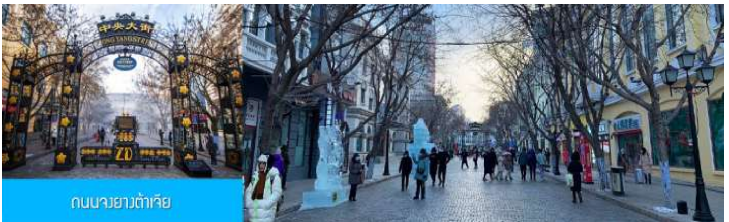
ถนนจงยางต้าเจีย