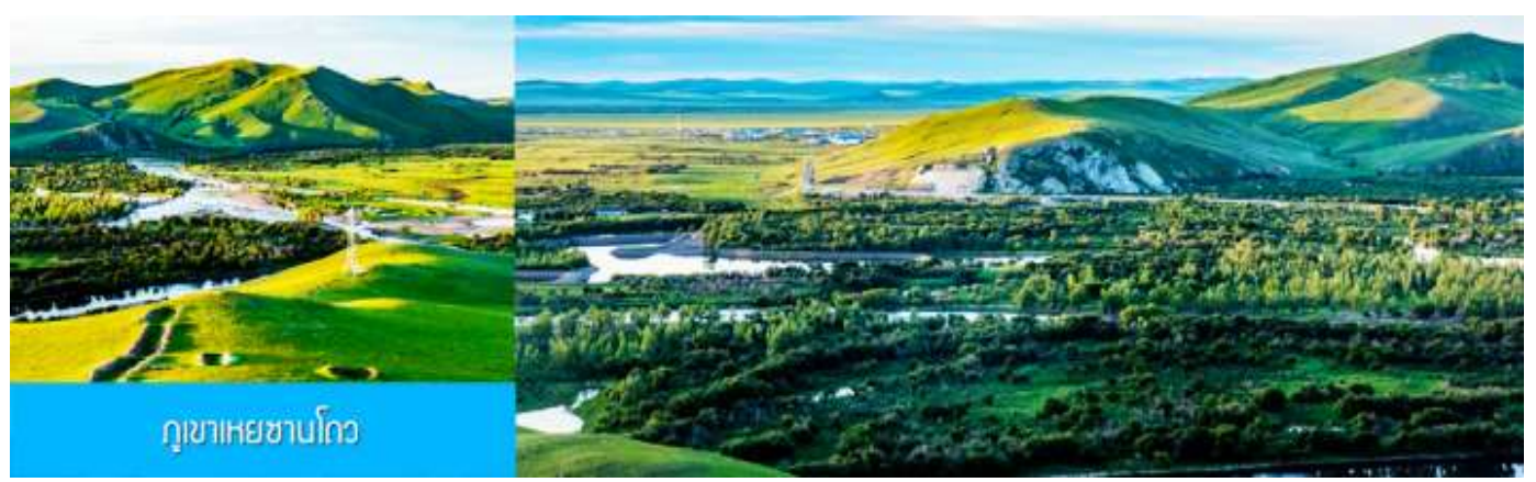
ภูเขาเหยาซานโถว

เช้า รับประทานอาหารเช้า ณ ห้องอาหารของโรงแรม (13)