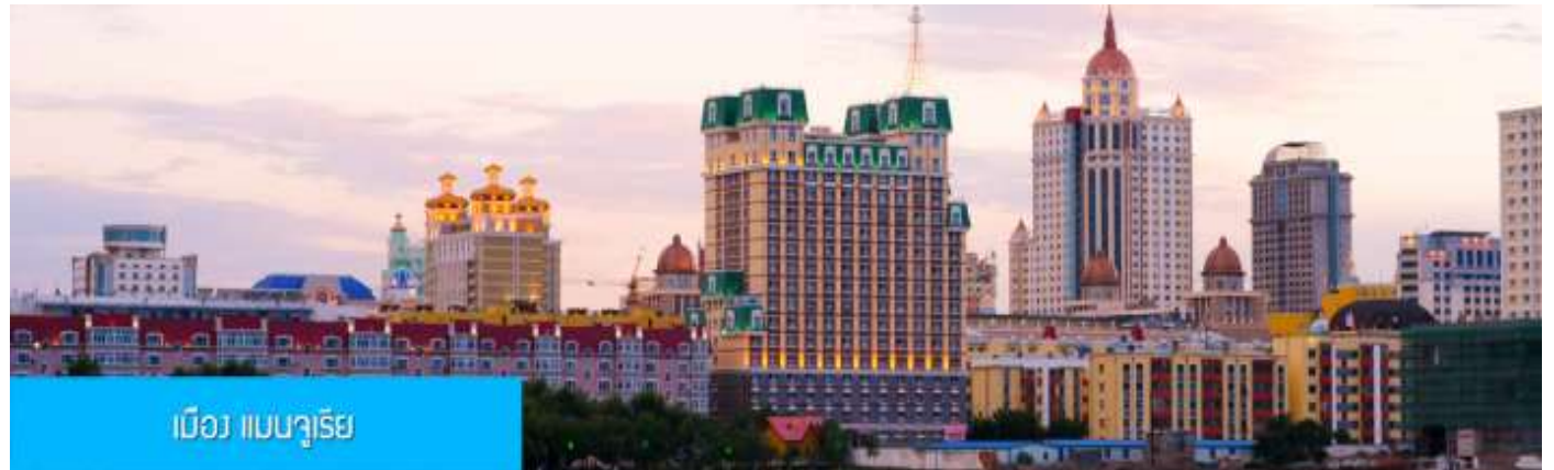
เมือง แมนจูเรีย