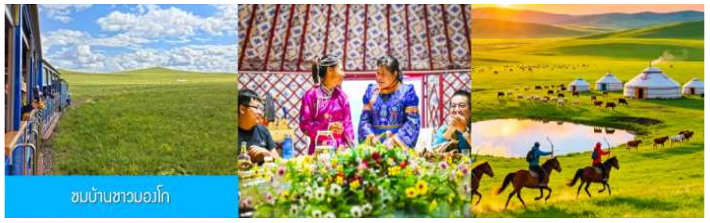
ชมบ้านชาวมองโก

เที่ยง รับประทานอาหารกลางวัน ณ ภัตตาคาร (14)