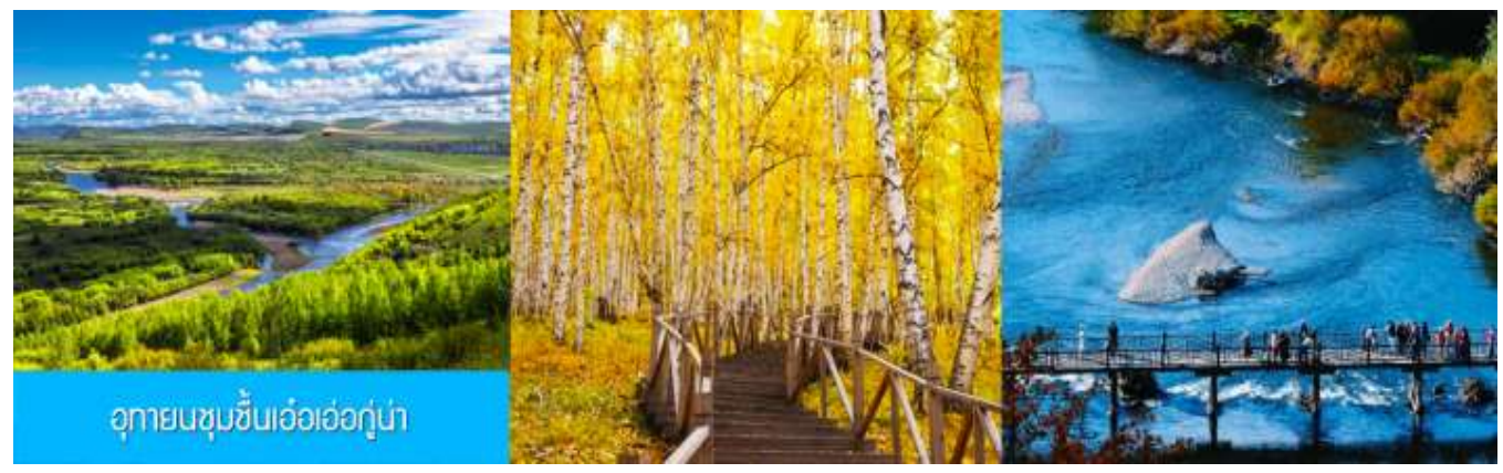
อุทยานชุ่มชื้นเอ้อเอ๋อกู่่น่า

เช้า รับประทานอาหารเช้า ณ ห้องอาหารของโรงแรม (16)