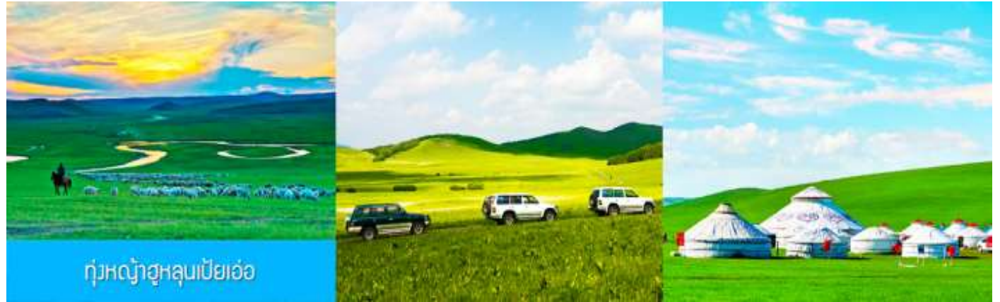
ทุ่งหญ้าฮูลุนเปี้ยเอ๋อ