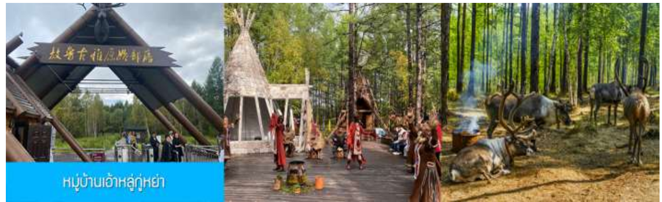
หมู่บ้านเอ้อเอ๋อกู่หย่า