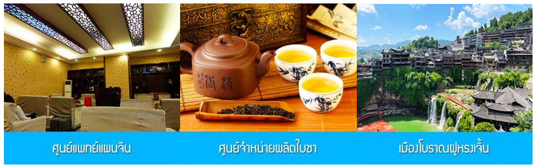
ศูนย์แพทย์แผนจีน

พักที่ HANTING HOTEL ระดับ 4 ดาวท้องถิ่นหรือเทียบเท่าในเมืองจางเจียเจี๋ย