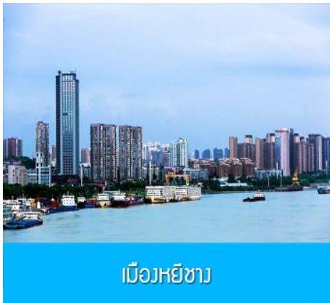
เมืองหยี่ชาง