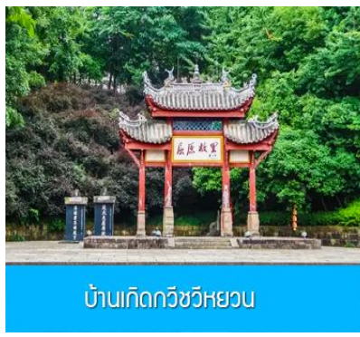
บ้านเกิดกวีซีเหยวน