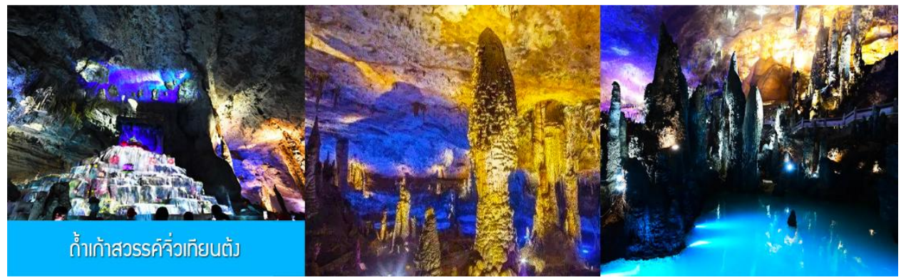
ถ้ำแก้วสวรรค์วิวัฒนาการ

จากนั้นนำท่านเดินทางเข้าที่พักในเมืองจางเจียเจี๋ย พักที่ HANTING HOTEL ระดับ 4 ดาวท้องถิ่นหรือเทียบเท่าในเมืองจางเจียเจี๋ย