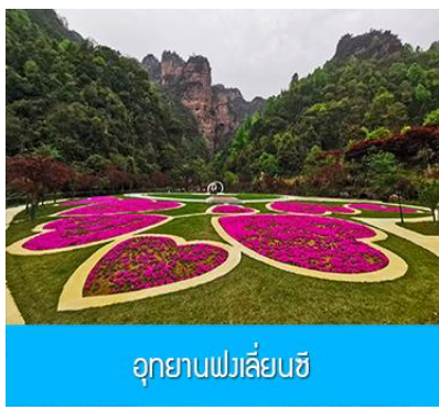
อุทยานฟงเลี่ยนซี