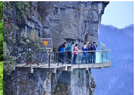
หน้าผาลอยฟ้าทางเดินกระภาค

หลังอาหาร ไกด์นำเสนอโปรแกรมทัวร์เสริมหรือ OPTIONAL TOUR เพื่อเก็ทท่องเที่ยวภูเขาเทียนเหมินซานหรือภูเขาถ้ำประตูสวรรค์ อัตราค่าบริการท่านละ 600 หยวนหรือ 3,000 บาท อัตรานี้รวมค่าบริการเข้าอุทยานฯ รถรับส่ง กระเช้าขึ้น ลงเขาเทียนเหมินซาน ระเบียบกระจกเลียบหน้าผา บัน ไคเลี่ยนทะเลภูเขา ค่าประกันอุบัติเหตุ และค่าบริการของไกด์ท้องถิ่น ระยะเวลาสำหรับแพ็คเกจประมาณ 3-4 ชั่วโมง (ขึ้นอยู่กับจำนวนนักท่องเที่ยวในแต่ละวัน)