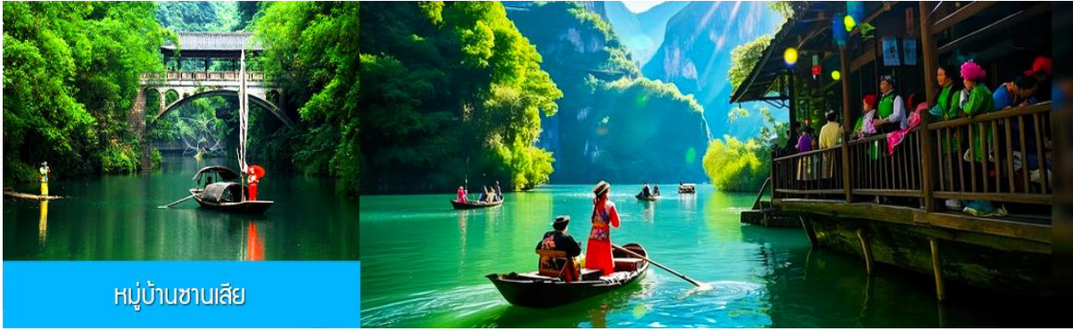
หมู่บ้านชาวนเลีย