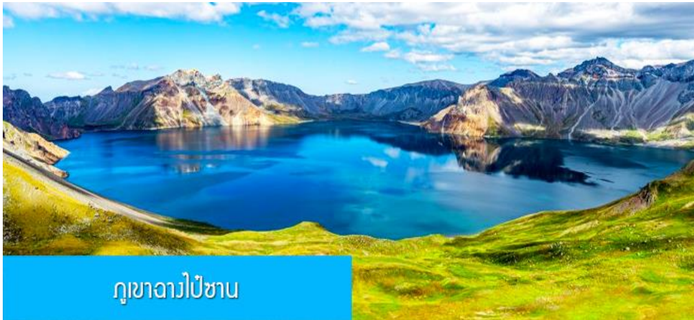
ภูเขาฉางไป๋ซาน