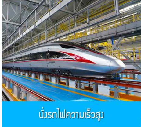
บริการรถไฟความเร็วสูง

หลังอาหารนำท่านเดินทางสู่สถานีรถไฟความเร็วสูงเมืองฮาร์บิ้น เตรียมขึ้นรถไฟความเร็วสูงสู่กรุงปักกิ่ง