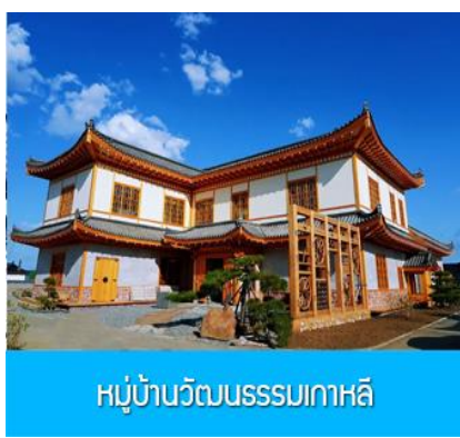
หมู่บ้านวัฒนธรรมเกาหลี

จากนั้นนำท่านเดินทางสู่เมืองตุนฮว่า 敦化 (ระยะทาง 130 กม. ใช้เวลาเดินทางราว 2 ชั่วโมง)