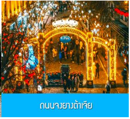
ถนนยาวต้าเจีย