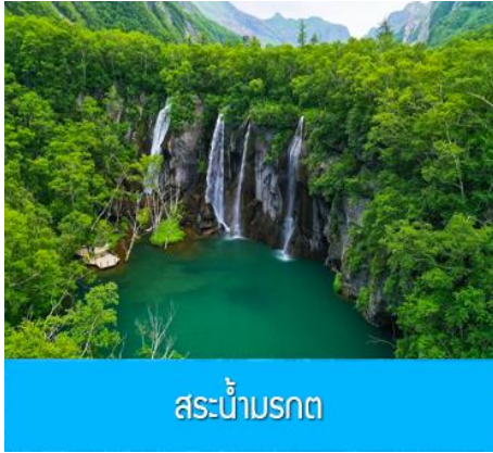
สระน้ำมรกต