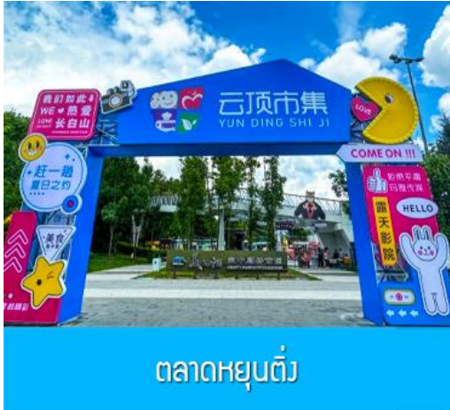
ตลาดหยุนต้ง