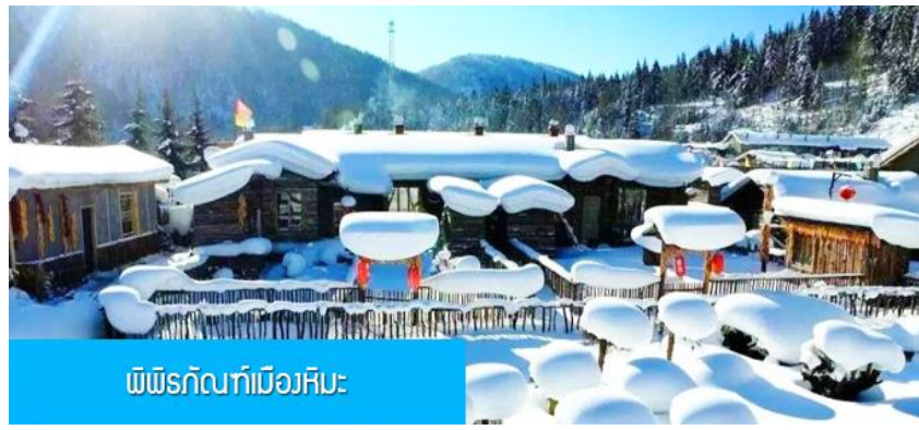
พิพิธภัณฑท์เมืองหิมะ

และเครื่องใช้จำเป็นสำหรับการพักผ่อน ณ โฮมสเตย์ในเมืองหิมะในคืนนี้ เพื่อสะดวกต่อการเคลื่อนย้ายกระเป๋า ภายในโฮมสเตย์จะมีสบู่น้ำหอม แชมพูภายในห้องน้ำ แปรงสีพื้นยาตีพื้น แต่จะไม่มีหมวกคลุมผมสำหรับสุภาพสตรี ควรเตรียมไปด้วย