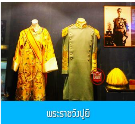
พระราชวังปู้ยี่

หลังอาหารเช้าท่านเช็คเอาท์ออกจากโรงแรมที่พักแล้วเดินทางสู่ เมืองฉางชุน 长春市 (ระยะทาง 120 กม.ใช้เวลาเดินทางราว 1 ชั่วโมงครึ่ง)