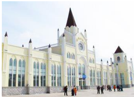
สถานีรถไฟยาบูลิ

หมายเหตุ เพื่อความสะดวกในการเข้าพักใน HOME STAY ภายในหมู่บ้านหิมะ ทางทัวร์แนะนำให้ท่านจัดเตรียมเสื้อผ้าและเครื่องใช้เท่าที่จำเป็น 1 ชุดใส่กระเป๋าใบเล็กหรือเป้แบบสะพายได้ เพื่อสะดวกในการนำติดตัวไปใช้สำหรับคืนที่นอนในหมู่บ้านหิมะ หากนำกระเป๋าเดินทางใบใหญ่เข้าสู่ที่พักในหมู่บ้านอาจสร้างความไม่สะดวกแก่ท่าน จึงไม่แนะนำ