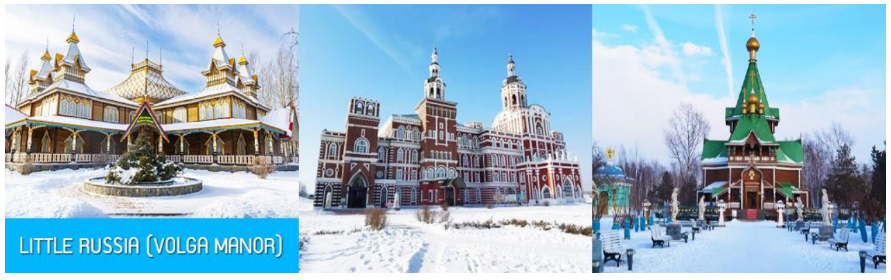
LITTLE RUSSIA (VOLGA MANOR)

จากนั้นนำท่านเที่ยวชม สวนคฤหาสน์อลีก้า LITTLE RUSSIA (VOLGA MANOR) 伏尔加庄园 สวนคฤหาสน์ที่ออกแบบคล้ายพระราชวังสไตล์รัสเซียในยุคกลาง บนเนื้อที่กว่า 600,000 ตารางเมตร แหล่งท่องเที่ยวระดับ 4A และเป็นศูนย์แลกเปลี่ยนทางวัฒนธรรมจีนและรัสเซีย อาคารทุกหลังภายในสวนแห่งนี้ล้วนถูกออกแบบอย่างปราณีตโดยสถาปนิกชาวรัสเซีย ประกอบด้วยอาคารและคฤหาสน์หรูสไตล์รัสเซียที่โดดเด่นด้วยเอกลักษณ์ อาทิ วิหาร โรงแรม ภัตตาคาร พิพิธภัณฑ์ศิลปะ โบสถ์คริสต์ออร์ทอดอกซ์ โรงเหล้าวอดก้า ฯลฯ ที่แวดล้อมด้วยต้นไม้ สวนหย่อม ธารน้ำ สะพานไม้ เป็นแหล่งท่องเที่ยวสไตล์รัสเซียที่มีมุมเก็บภาพและจุดเช็คอินเก๋