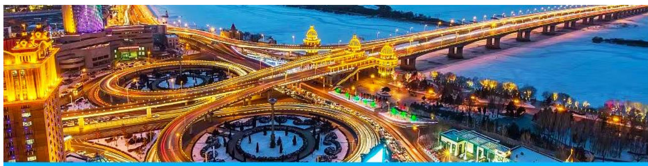
นครฮาร์บิน