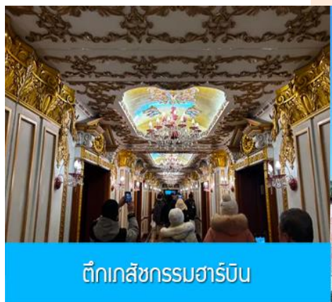
ตึกเภสัชกรรมฮาร์บิน

จากนั้นนำท่านเที่ยวชม ถนนจงยี่งู่ 中央大街 ถนนสายหลักของเมืองฮาร์บิน ถนนที่เต็มไปด้วยอาคารบ้านเรือนที่เป็นสถาปัตยกรรมตะวันตกที่สร้างในช่วงคริสต์ศตวรรษที่ 18 – 19 ที่เมืองนี้ถูกปกครองโดยรัสเซีย อีกทั้งเป็นถนนคนเดินที่เป็นแหล่งรวมร้านค้าสินค้าแบรนด์เนมทั้งในและต่างประเทศ ร้านจำหน่ายของที่ระลึกและสินค้าพื้นเมือง ร้านอาหารพื้นเมืองต่าง ๆ มากมาย ให้ท่านมีเวลาอิสระเดินเที่ยวและช้อปปิ้ง หรือลิ้มรสอาหารพื้นเมืองตามอัชยาศัย.. **ให้ท่านลิ้มรสไอศกรีมชื่อดังเก่าแก่ของเมืองฮาร์บินท่านละ 1 ท่านฟรี