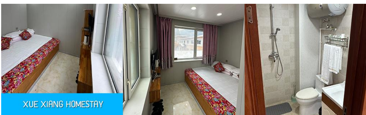
XUE XIANG HOMESTAY