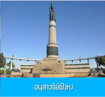
อนุสาวรีย์ผึ้ง