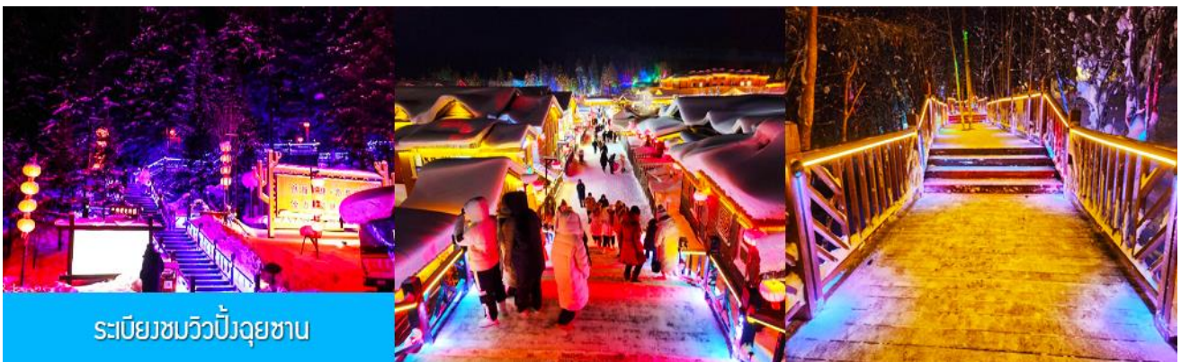
ระเบียงชมวิวยิ่งยวบ

หลังอาหารนำท่านเดินทางสู่ หมู่บ้านหิมะ 中国雪乡 XUE XIANG หรือ China Snow Town จุดหมายปลายทางสำหรับนักท่องเที่ยวที่ชื่นชอบหิมะในฤดูหนาว อยู่ห่างจากเมืองยาบูลิ ราว 88 กิโลเมตร ใช้เวลาเดินทางจากเมืองยาบูลิไปยังหมู่บ้านหิมะประมาณ 2 ชั่วโมง หมู่บ้านหิมะตั้งอยู่ด้านตะวันตกเฉียงใต้ของแม่น้ำหมู่ตันเจียง เป็นหมู่บ้านเล็ก ๆ ที่มีหิมะปกคลุมหนาฟูในช่วงฤดูหนาว ตั้งแต่เดือนตุลาคม จนกระทั่งเดือนพฤษภาคมของปีถัดไป ในช่วงกลางฤดูหนาวหิมะที่ปกคลุมจะมีความหนาประมาณ 1-2 เมตร ในฤดูหนาวที่นี่จะปกคลุมด้วยหิมะที่ขาวสะอาดบริสุทธิ์ ทุกสิ่งอย่างบนพื้นดินจะถูกเคลือบด้วยหิมะและน้ำแข็ง ดูราวเป็นภาพเทพนิยายในโลกแห่งจินตนาการ ได้รับการขนานนามว่าเป็น หมู่บ้านหิมะอันดับหนึ่งในปฐพี..... เมื่อเดินทางถึงหมู่บ้านหิมะ นำท่านเปลี่ยนมาใช้รถบัสของอุทยานเดินทางเข้าหมู่บ้าน เนื่องจากรถบัสส่วนตัวจะไม่สามารถเข้าไปในหมู่บ้านได้ นำท่านเช็คอินเข้าที่พักเรียบร้อยแล้ว