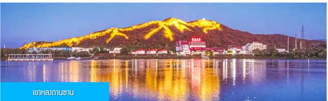
เขาสถกานชาน

หลังอาหารนำท่านผ่านชม วิวยามค่ำของเขา หลงถานชาน 龙潭山夜景 (ผ่านชมระยะไกล) ภูเขารูปทรงคล้ายมังกรในช่วงกลางคืนภูเขาถูกประดับด้วยแสงไฟที่สามารถมองเห็นแต่ไกล คล้ายรูปมังกร (บางคนมองว่าคล้ายรูปไดโนเสาร์) จากนั้นนำท่านเดินทางเข้าที่พัก