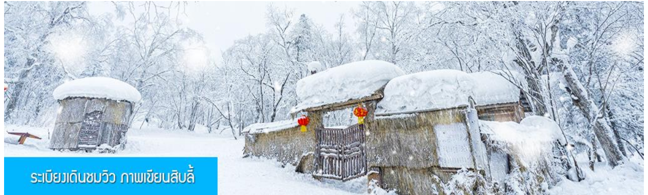
ระเบียบวณชมวิวกาภาพเขียนสิบลี้