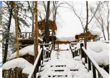
ระเบียงชมวิวปั้งจฺยฺชาน

วันที่สาม เมืองฮาร์บิน-สถานีรถไฟยาบูลิ-รวมนั่งม้าลากเลื่อน- หมู่บ้านหิมะ Xue xiang China Snow Town - ระเบียงชมวิว เขาปั้งจฺยฺชาน- ชมแสงสียามราตรีหมู่บ้านหิมะ-ชมพลุไฟและขบวนพาเหรดระบำพื้นเมือง-นอนในหมู่บ้านหิมะ Xue xiang