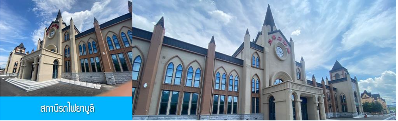
สถานีรถไฟยาบูลี

นำท่านเที่ยวชม สถานีรถไฟยาบูลี 亚布力南站 (ชมด้านนอก) ได้ชื่อว่าเป็นสถานีรถไฟที่สวยงามที่สุดของจีน โดดเด่นด้วยสถาปัตยกรรมแบบตะวันตก ให้ท่านเก็บภาพบรรยากาศความสวยงามของสถานีรถไฟที่ปัจจุบันยังคงเปิดให้บริการอยู่