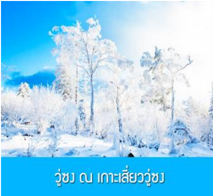
วู้ชง ณ เกาะสิ่ววู้ชง

พักที่ JILIN LUNWEIKE HOTEL โรงแรมระดับ 4 ดาวท้องถิ่นหรือเทียบเท่า ในเมืองจีหลิน