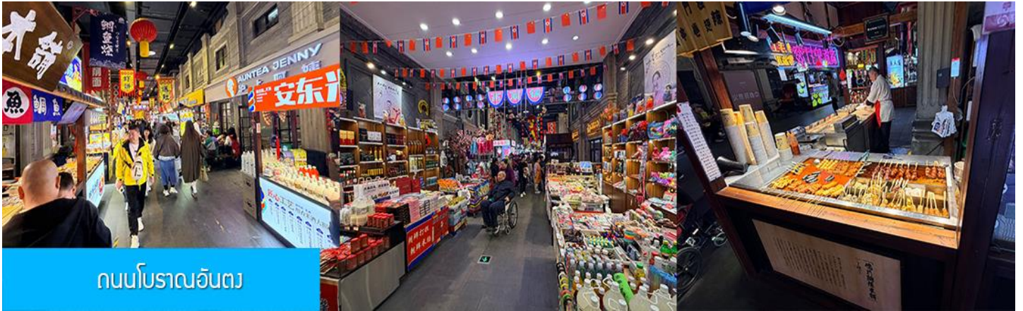
ถนนโบราณอันตง

จากนั้นนำท่านเที่ยวชม ถนนโบราณอันตง 安东老街 ถนนโบราณนี้เริ่มมีชื่อเสียงในฐานะเป็นย่านการค้าที่คึกคักที่สุดในใจกลางเมืองอันตง (ภายหลังได้เปลี่ยนชื่อเป็นต้นตง) ในปีค.ศ. 1876 ในสมัยราชวงศ์ชิง ปัจจุบันถนนสายนี้ยังคงไว้ซึ่งอาคารบ้านเรือนยุคเก่า(ราชวงศ์ชิง) และอบอวลด้วยวัฒนธรรมพื้นเมืองโบราณ ท่านจะได้สัมผัสการละเล่นและการแสดงพื้นเมือง ร้านค้าจำหน่ายของที่ระลึก ร้านอาหารท้องถิ่น และสตรีทฟู้ด ฯลฯ