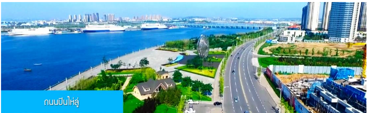
ถนนปินไห่หลู่

ล้อมด้วยตึกระฟ้าที่ทันสมัย ภายในมีบ่อน้ำพุคนตรี ลานหญ้าขนาดใหญ่ และลานกว้างสำหรับจัดกิจกรรม กลางแจ้ง อาทิ เทศกาลเบียร์นานาชาติ การแข่งขันวิ่งมาราธอน งานแฟชั่นนานาชาติเมืองต้าเหลียน ฯลฯ