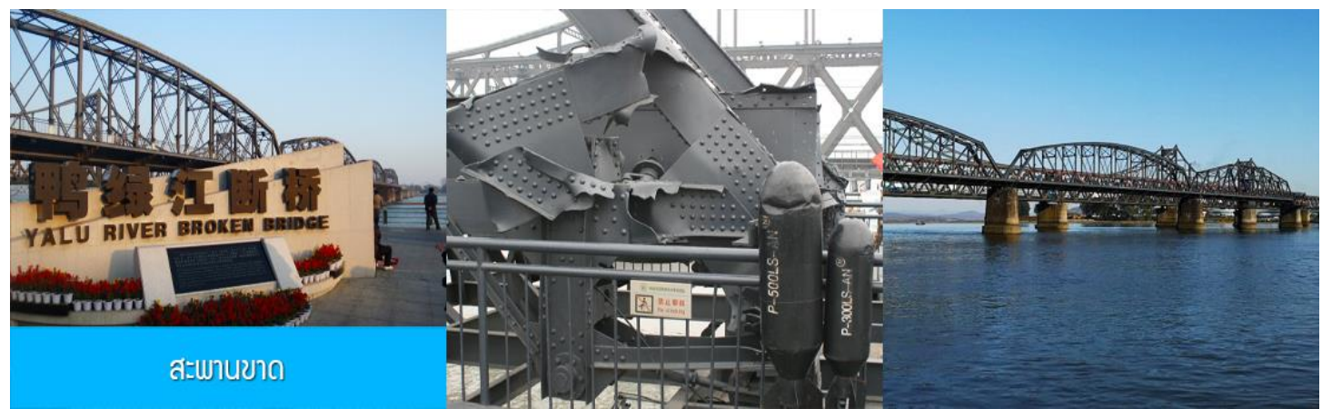
สะพานขาด