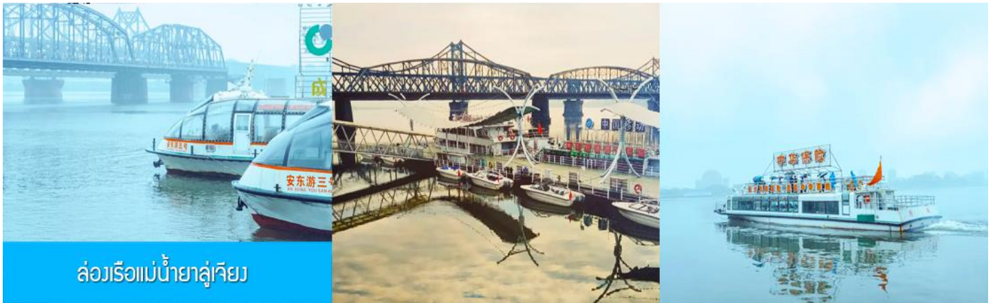
ล่องเรือแม่น้ำยาลูเจียง

หลังอาหารให้ท่านพักผ่อนตามอัชฌาศัยในโรงแรม