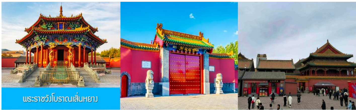
พระราชวังโบราณเสิ่นหยาง