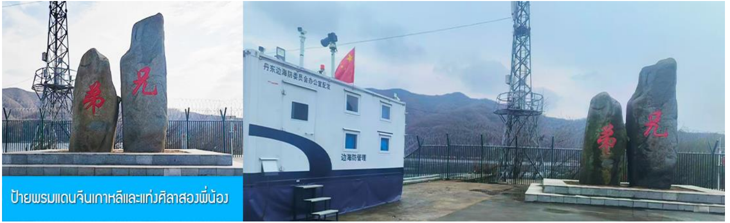
ป้ายพรมแดนจีนเกาหลีและแท่งศิลาสองพี่น้อง