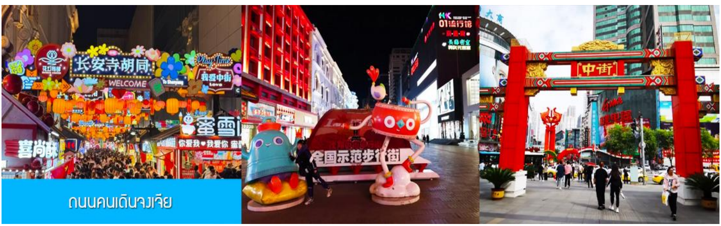
ถนนคนเดินจางเจีย