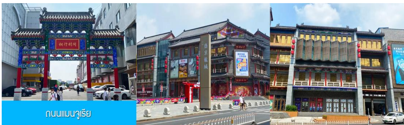
ถนนแมนจูเรีย