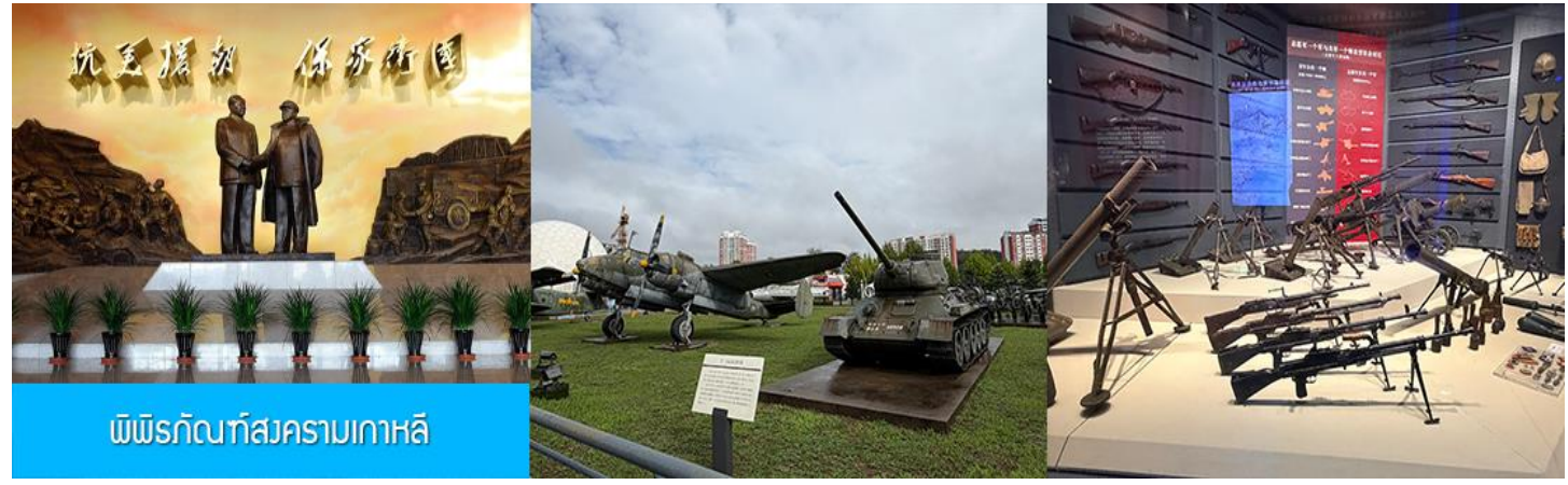
พิพิธภัณฑ์สงครามเกาหลี