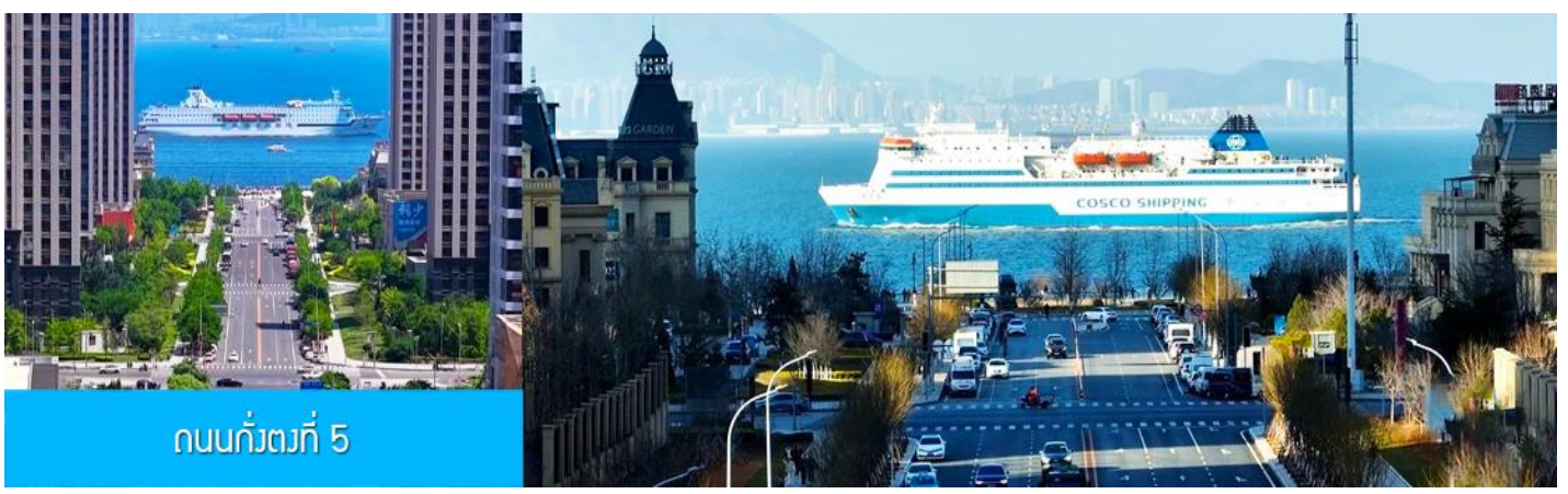
ถนนกั๋วตงที่ 5