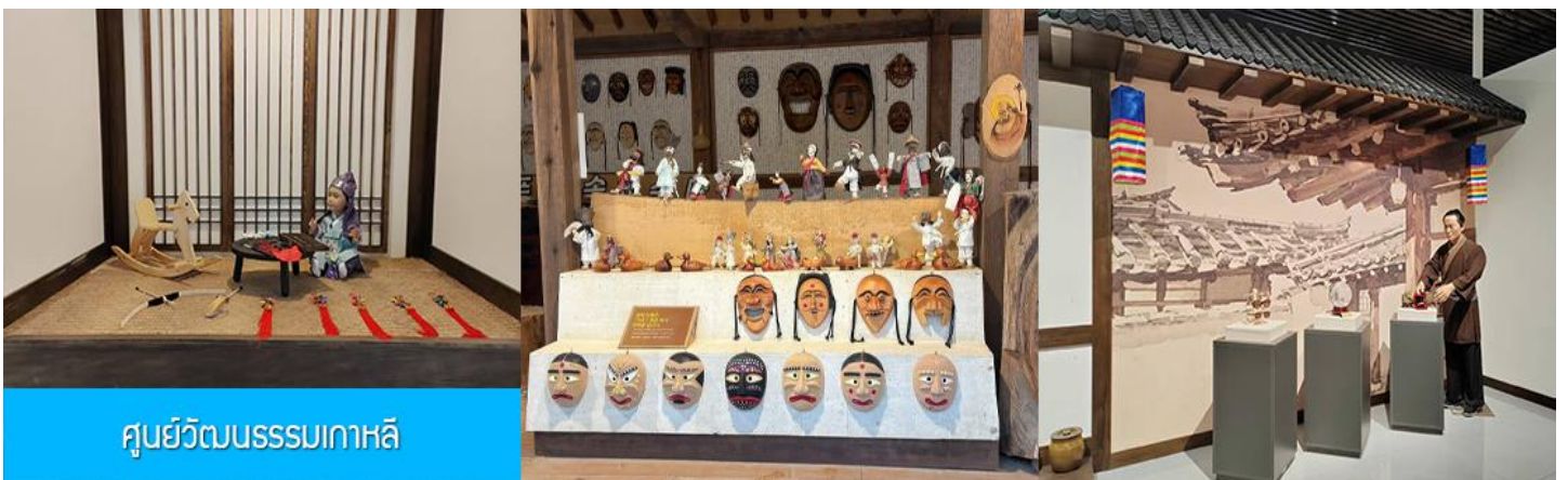
ศูนย์วัฒนธรรมเกาหลี

เช้า รับประทานอาหารเช้า ณ ห้องอาหารของโรงแรม (9)