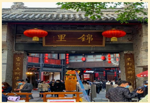
เช้า บริการอาหารเช้า ณ ห้องอาหารของโรงแรม นำท่านเดินทางสู่ ถนนคนเดินจิ้งหลี่ ถนนคนเดินสไตล์จีนโบราณยุคราชวงศ์ซ่งที่คึกคักและมีประวัติศาสตร์ยาวนานกว่า 1,800 ปี ขึ้นชื่อเรื่องสถาปัตยกรรมสวยงาม โคมแดง อาหารเสฉวนพื้นเมือง ของที่ระลึก และการแสดงวัฒนธรรม ตั้งอยู่ติดกับศาลเจ้าสามก๊ก อีกทั้งยังรวมสตรีทฟู้ดเสฉวนรสจัดจ้าน เช่น หม่าล่าถั๋ง, เต้าหู้เหม็น, และขนมพื้นเมือง

วันที่หก ถนนคนเดินจิ้งหลี่ - สนามบินเทียนฝู - สนามบินสุวรรณภูมิ (B/L/-)