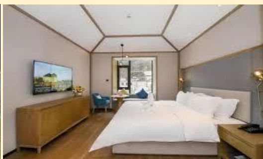
CTUO1 THE KING 3ราชาแห่งขุนเขา 6วน5คน (MU) ต.ค.-พ.ย.69