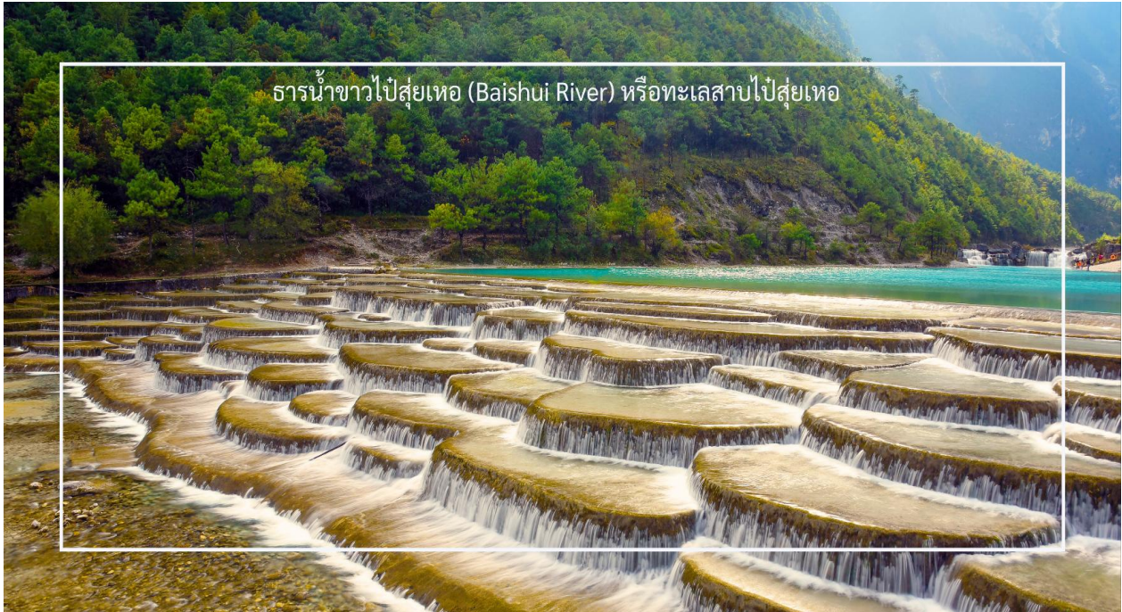
ธารน้ำขาวไป๋ส่วยเหอ (Baishui River) หรือทะเลสาบไป๋ส่วยเหอ

เที่ยวชม ทะเลสาบไป๋ส่วยเหอ (Baishui River) หรือทะเลสาบไป๋ส่วยเหอ หรืออีกชื่อหนึ่งคือ หุบเขาพระจันทร์สีน้ำเงิน (Blue Moon Valley) (รวมค่าบริการรถแบดเตอร์) เป็นสถานที่ท่องเที่ยวที่มีความงดงามทางธรรมชาติ ที่นี่คือทะเลสาบที่เกิดจากการละลายของหิมะบนภูเขาหิมะมังกรหยก มีน้ำใสสะอาดสะอาดสีเทอควอยซ์สะท้อนกับท้องฟ้าและภูเขารอบๆ เกิดธารน้ำตกหินปูนเล็ก ๆ ที่เรียงลดหลั่นกันขึ้น ๆ สวยงามจนเปรียบเสมือนสวรรค์บนดิน ทำให้เป็นสถานที่ที่เหมาะสมสำหรับการถ่ายรูปและพักผ่อนเป็นอย่างมาก