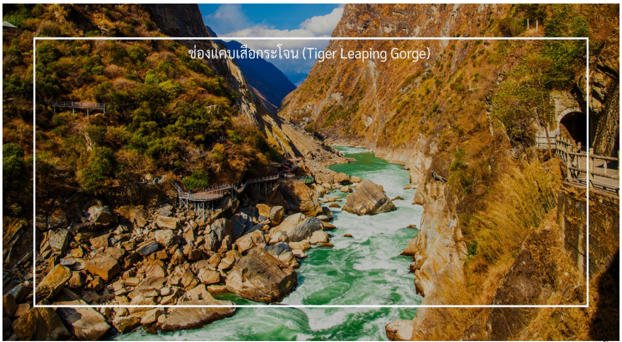
ช่องแคบเสือกระโจน (Tiger Leaping Gorge)

เที่ยวชม เมืองโบราณแชงกรีล่า (Shangri-La Ancient Town) เป็นสถานที่ท่องเที่ยวที่โดดเด่นในเมืองแชงกรีล่า ซึ่งตั้งอยู่ในมณฑลยูนนาน ประเทศจีน เมืองโบราณนี้มีความสำคัญทั้งในด้านประวัติศาสตร์และวัฒนธรรม เมืองโบราณมีบ้านเรือนที่สร้างขึ้นในสไตล์ทิเบตและชาวหนาน ซึ่งมีการตกแต่งที่สวยงามและมีเอกลักษณ์เฉพาะตัว เป็นศูนย์กลางวัฒนธรรมของชาวทิเบต มีตลาดที่ขายสินค้าท้องถิ่น เช่น เครื่องประดับแบบทิเบต ผ้าทอมือ และอาหารพื้นเมือง นักท่องเที่ยวสามารถเลือกซื้อของที่ระลึกและสัมผัสกับบรรยากาศของตลาดที่มีชีวิตชีวา เมืองโบราณตั้งอยู่ใกล้กับสถานที่ท่องเที่ยวสำคัญ เช่น วัดซงจ้านหลิง (Songzanlin Monastery) ซึ่งเป็นวัดที่สำคัญที่สุดในเขตนี้