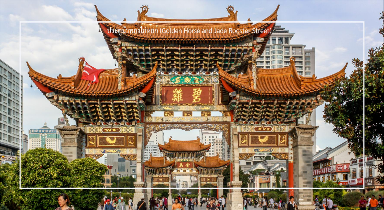
ประตูม้าทองโก๋หยก (Golden Horse and Jade Rooster Street)

อิสระช้อปปิ้งถนนคนเดิน ประตูม้าทองโก๋หยก (Golden Horse and Jade Rooster Street) เป็นแหล่งช้อปปิ้งที่มีชื่อเสียงในเมืองคุนหมิง (Kunming) สถานที่นี้เป็นที่นิยมของนักท่องเที่ยวและชาวเมืองสำหรับการช้อปปิ้ง สัมผัสวัฒนธรรมท้องถิ่น และลิ้มลองอาหารอร่อย ถนนคนเดินนี้มีร้านค้าหลายประเภท เช่น เสื้อผ้า ของที่ระลึก งานศิลปะ และของกินท้องถิ่น นักท่องเที่ยวสามารถเลือกซื้อสินค้าต่างๆ ได้ตามใจชอบ ถนนคนเดินนี้เต็มไปด้วยชีวิตชีวา มีการแสดงสด ดนตรี และกิจกรรมต่างๆ ที่ทำให้บรรยากาศสนุกสนานและน่าตื่นเต้น และยังมีร้าน POP MART ให้เหล่าสาวก ART TOY ให้เลือกซื้อคอลเลกชันแปลกใหม่ ที่อาจจะหาซื้อไม่ได้ในเมืองไทย