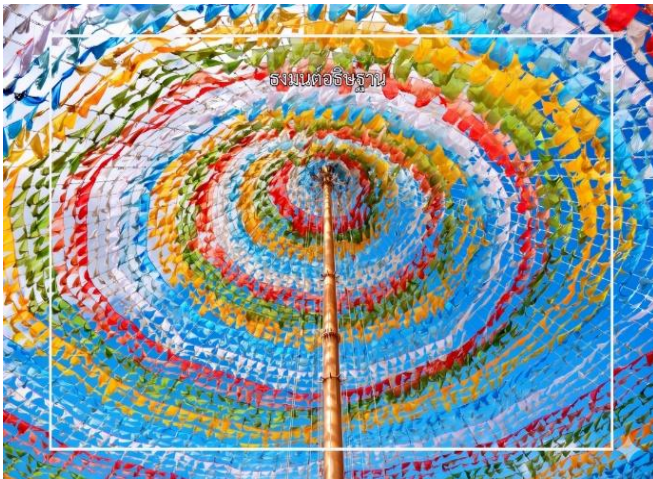
รถเข็นล้ออธิษฐาน

จากนั้นนำท่านชม ธงมนต์อธิษฐาน เป็นความเชื่อของชาวทิเบต จะมีบทสวดหรือคำอธิษฐานพิมพ์อยู่บนผืนผ้าเชือกกันว่าเวลาลม พัดธงจะช่วยพัดพาคำอธิษฐานเหล่านั้นออกไป เปรียบเหมือนการ ส่งพรดีๆ ให้กับทั้งตัวเราและคนรอบข้าง