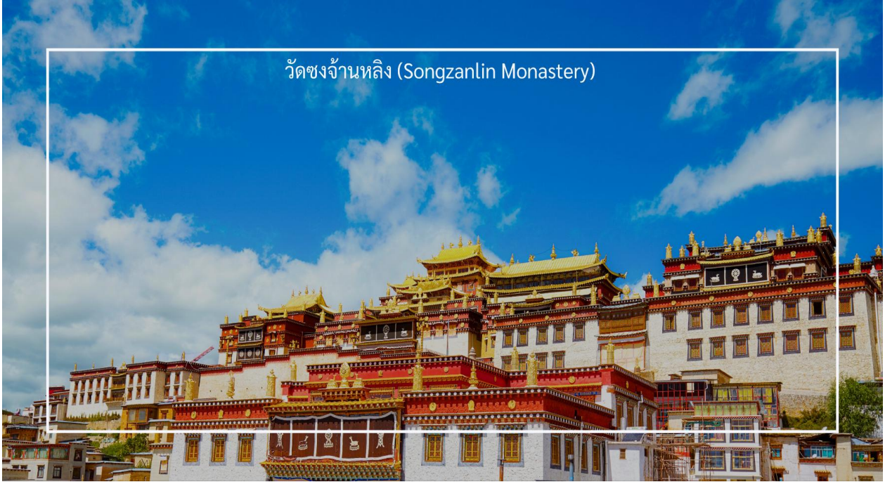
วัดซงจั้นหลิง (Songzanlin Monastery)