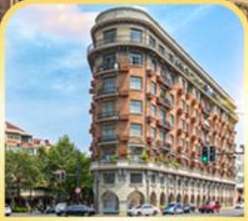
อาคารอู่คัง