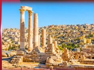
ป้อมปราการรัมมาน