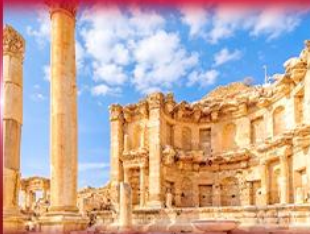
เมืองโบราณเจราซ