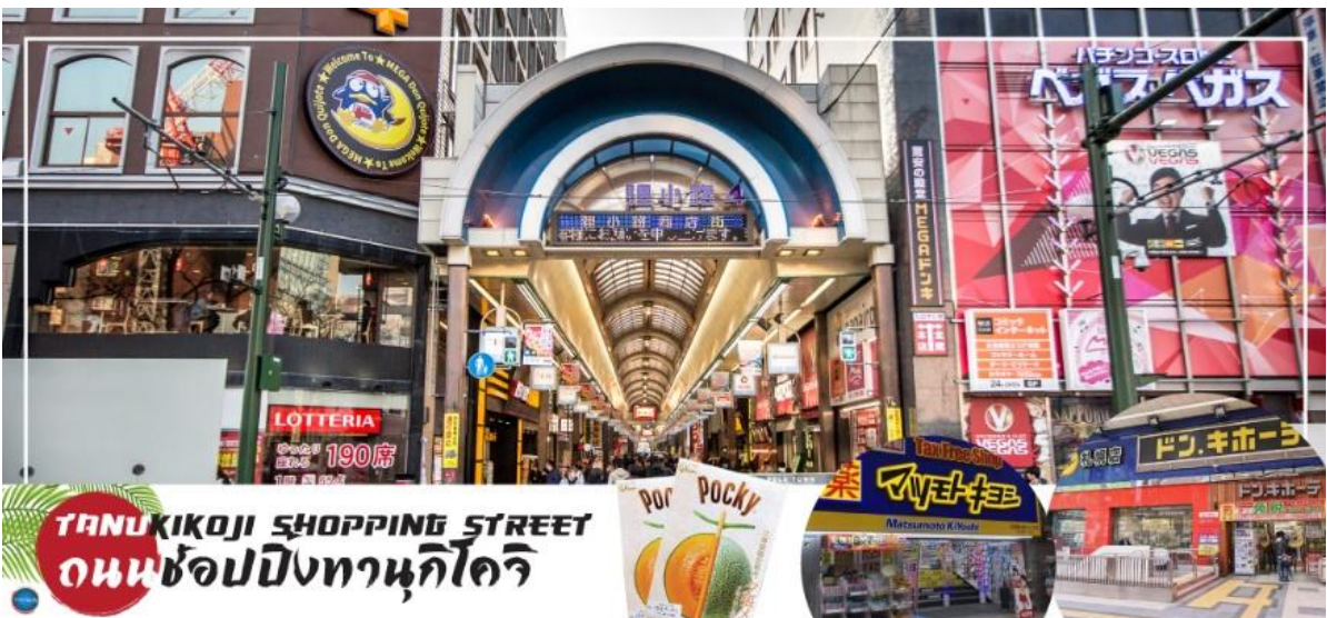
TANUKIKOJI SHOPPING STREET ถนนช้อปปิ้งทานุกิโคจิ

ที่พัก SMILE HOTEL PREMIUM - SAPPORO SUSUKINO หรือเทียบเท่าระดับเดียวกัน