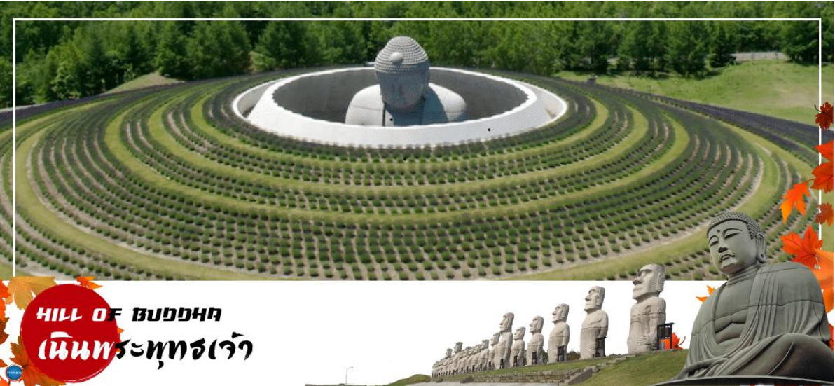
HILL OF BUDDHA เนินพระพุทธรเจ้า

วันที่สี่ เมืองซัปโปโร – เนินพระพุทธรเจ้า – เมืองโจซังเค – ชมสะพานแขวนฟตามิ สิริบาชิ – สวนโจซังเคเกินเซน – เมืองซัปโปโร – นั่งกระเช้าชมวิว ณ ภูเขาโมอิอะ – ย่านซูซุกิโนะ