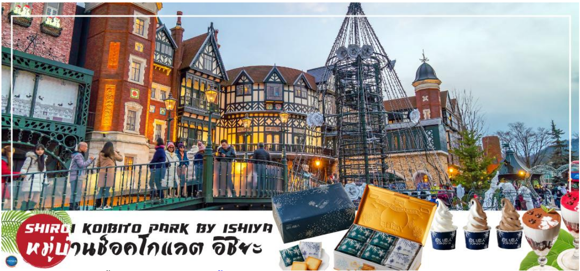
SHIROI KOIBITO PARK BY ISHIYA หมู่บ้านช็อคโกแลต อิชียะ

โกแลตที่ขึ้นชื่อที่สุดของที่นี่คือ Shiroi Koibito ซึ่งมีความหมายว่าช็อคโกแลตขาวแต่คนรัก ท่านสามารถเลือกซื้อกลับไปให้คนที่ท่านรักทานหรือว่าซื้อเป็นของฝากติดไม้ติดมือกลับบ้านก็ได้ นอกจากนี้ท่านจะได้เลือกซื้อช็อคโกแลตที่หาซื้อที่ไหนไม่ได้ และ ท่านก็ยังจะได้ชมประวัติความเป็นมาของโรงงาน และการผลิตช็อคโกแลตอีกด้วย