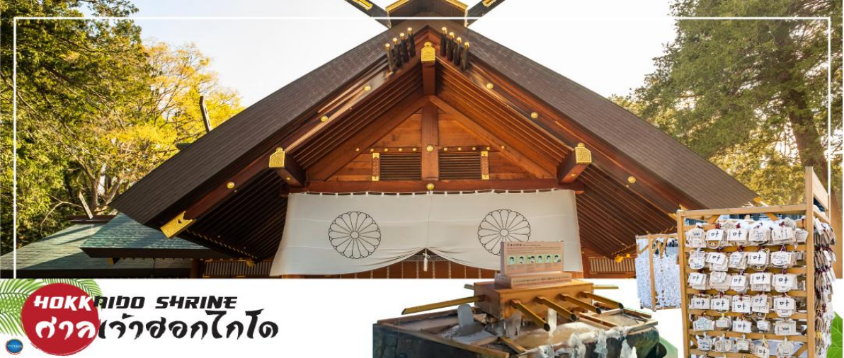
HOKKAIDO SHRINE ศาลเจ้าฮอกไกโด

นำท่านขอพร ศาลเจ้าฮอกไกโด (Hokkaido Shrine) หรือเดิมชื่อ ศาลเจ้าซัปโปโร เปลี่ยนเพื่อให้สอดคล้องกับความยิ่งใหญ่ของเกาะเมืองฮอกไกโด ศาลเจ้าชินโตนี้คอยปกป้องรักษาให้ชนชาวเกาะฮอกไกโดมีความสุขถึงแม้จะไม่ได้มีประวัติศาสตร์อันยาวนาน