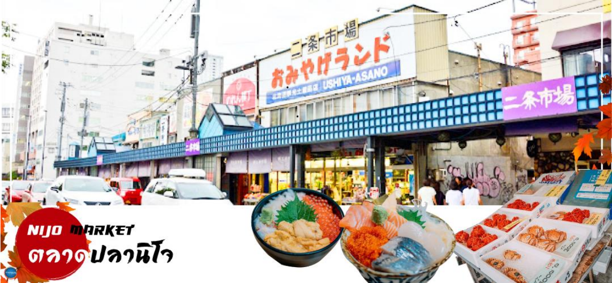
NIJO MARKET ตลาดปลาโนโจ

จากนั้นนำท่านเดินทางสู่ เมืองซัปโปโร (SAPPORO) (ใช้เวลาเดินทางประมาณ 1 ชั่วโมง) เพื่อนำท่านสู่ ตลาดปลาโนโจ (Nijo Market) ตลาดปลาใจกลางเมืองซัปโปโร แม้มิมีขนาดใหญ่โตมากแต่ด้วยที่อยู่กลางเมือง เดินทางสะดวกและสินค้าครบครัน เป็นที่นิยมของนักท่องเที่ยวญี่ปุ่นและต่างชาติจำนวนมาก ตลาดปลาแห่งนี้ประกอบไปด้วยร้านจำหน่ายอาหารทะเลสดๆ ร้านจำหน่ายสินค้าแปรรูป ต่างๆ ห้ามพลาด!!! สำหรับผู้ที่ชื่นชอบรสชาติของปูชนยักษ์ อันเลื่องชื่อแห่งเกาะฮอกไกโด ที่ตลาดแห่งนี้ท่านจะเห็นปูชนตัวเป็นๆ วางหน้าในตู้ ที่ต้องบอกว่าราคาไม่แพง หรือ จะเป็น หอยเชลล์ย่าง ที่ทานกับโชยุ นอกจากนี้ ยังมีร้านอาหารที่อยู่ด้านหลังผ้าม่านใสๆ กันจก หากท่านอยากทานอาหารปรุงสุก สดใหม่ก็สามารถออเดอร์ด้านหน้าและเข้าไปรอนั่งรับประทานอาหารด้านหลังได้เลย ก่อนจะอิมกันยังมีเมล่อนสีส้มหวานฉ่ำ ที่มาทานปิดท้ายอีกด้วย