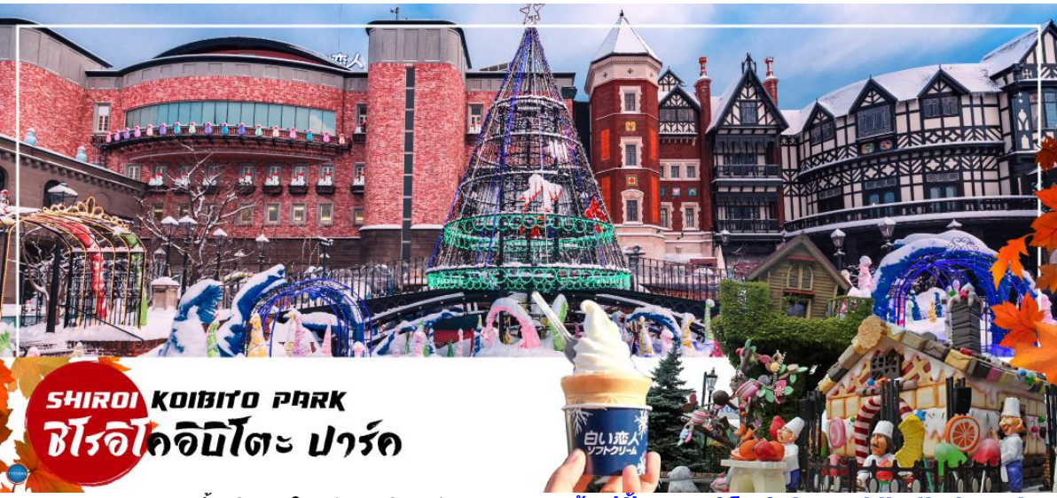
SHIROI KOIBITO PARK ชิโรอิโคอิบิโตะ ปาร์ค

นำท่านสู่ หมู่บ้านช็อคโกแลต อิชิยะ (Shiroi Koibito Park by Ishiya) (ด้านนอก) แหล่งผลิตช็อคโกแลตที่มีชื่อเสียงของญี่ปุ่น ตัวอาคารของ โรงงานถูกสร้างขึ้นในสไตล์ยุโรป แวดล้อมไปด้วยสวนดอกไม้ จึงทำให้บรรยากาศของหมู่บ้านช็อคโกแลตที่นี่ดูคลาสสิกและน่ารักไปอีกแบบช็อคโกแลตที่ขึ้นชื่อที่สุดของที่นี่คือ Shiroi Koibito ซึ่งมีความหมายว่าช็อคโกแลตขาวแต่คนรัก ท่านสามารถเลือกซื้อกลับไปให้คนที่ท่านรักทานหรือว่าซื้อเป็นของฝากติดไม้ติดมือกลับบ้านก็ได้ นอกจากนี้ท่านจะได้เลือกซื้อช็อคโกแลตที่หาซื้อที่ไหนไม่ได้ และท่านก็ยังจะได้ชมประวัติความเป็นมาของโรงงาน และการผลิตช็อคโกแลตอีกด้วย