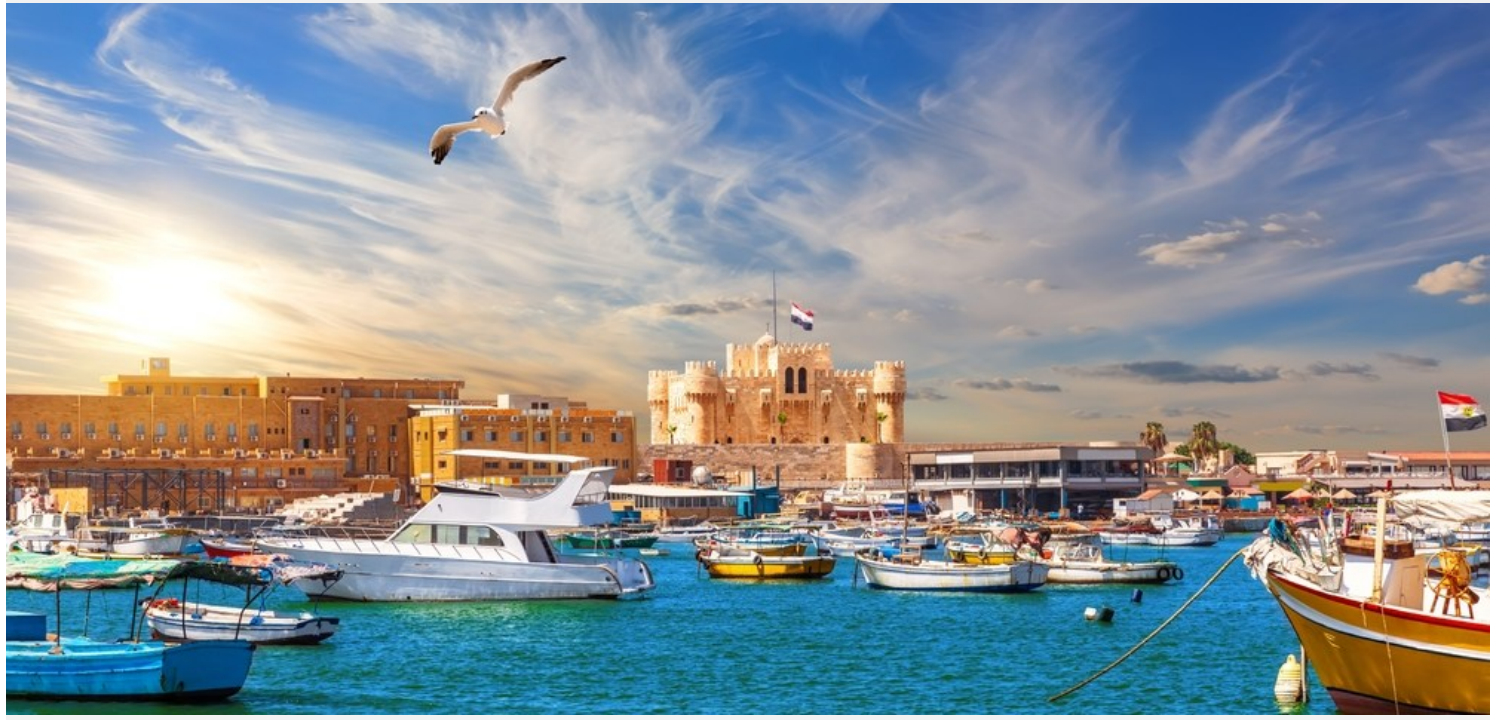
เดรียที่อยู่เหนือสุดอียิปต์ ริมหะเลเมดิเตอร์เรเนียน ไกล่ปากแม่น้ำไนล์ เมืองแห่งนี้เป็นเมืองท่าที่สำคัญ ได้สมญานามว่า "เมืองไข่มุกแห่งเมดิเตอร์เรเนียน"