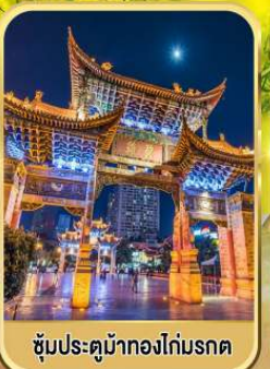
ซุ้มประตูม้าทองโก๋มรดก