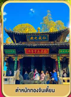
ศาลาหมิงก๊องจินเตี้ยน

4วัน 3คืน เมนูพิเศษ! เปิดอย่าง สุกก็เห็ด