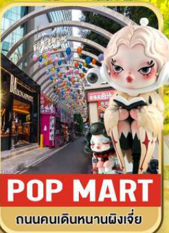
POP MART ถนนคนเดินหนานผิงเจี๋ย