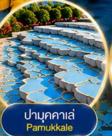
ปามุกคาเล่ Pamukkale