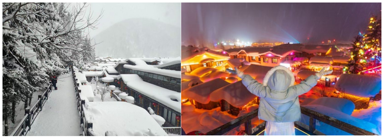
Optional: DREAM HOME (ราคาประมาณ 200หยวน/ท่าน)

เขาปางจย ระเบียงชมวิวมู่บ้านหิมะ: เดินขึ้นทางลาดไม้เพื่อชมวิวกาโนรามของหมู่บ้านจากมุมสูง ท่านจะเห็นภาพ "บ้านเห็ดหิมะ" ที่เรียงรายกันอย่างสวยงามเหมือนเทพนิยาย ให้ท่านเดินเล่น ถ่ายรูปตามอัธยาศัย