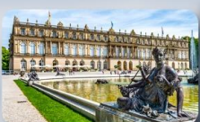
พระราชวัง Herrenchiemsee