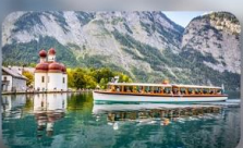
ทะเลสาบเคอนิกซี