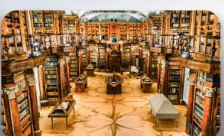
หอสมุดมรดกโลก St.Gallen