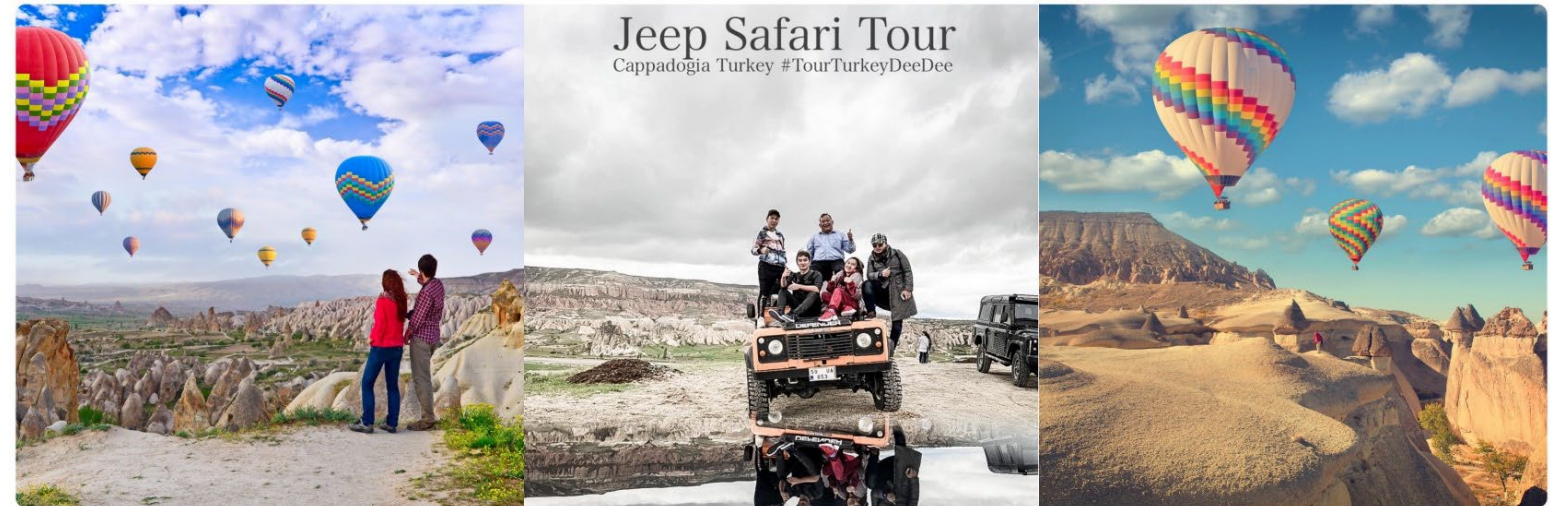
Jeep Safari Tour Cappadogia Turkey #TourTurkeyDeeDee