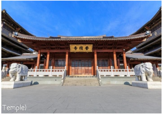
วัดเซียงจี (Xiangji Temple)