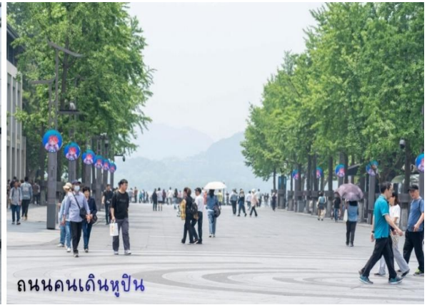
ถนนคนเดินหูปิ่น

นำท่านสู่จุดชมวิว City Balcony หรือเฉลียงของเมือง เป็นสวนสาธารณะต้นไม้สีเขียวย่านใจกลางเมือง มีที่นั่งตามขั้นบันได อีกทั้งท่านยังสามารถมองเห็น Intercontinental Hangzhou ลูกบอลสีทอง ห้องพักทุกห้องเปิดรับวิว 360 องศา รวมทั้งตึกเปิดประดับไฟสวยงาม พร้อมชมวิววิวทิวทัศน์ธรรมชาติสวยงามรอบๆ