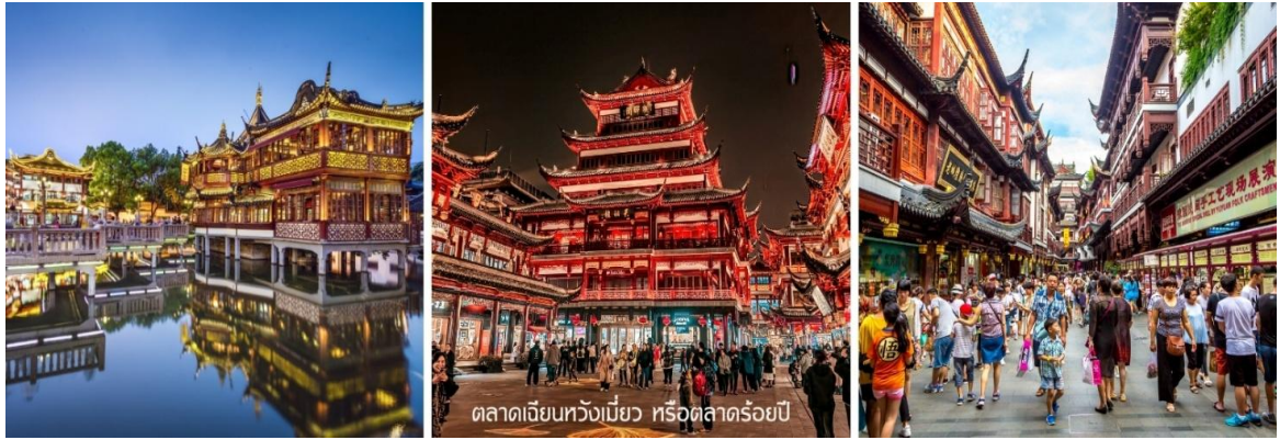
ตลาดเจียนหวงเปี้ยว หรือตลาดร้อยปี