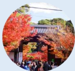
จุดประตูไซมง เป็นประตูทางเข้าหลักของวัดเอคันโด

นำท่านเดินทางสู่ เกียวโต เป็นเมืองที่ได้ชื่อว่าเป็นเมืองแห่งศิลปะและวัฒนธรรมของญี่ปุ่นอย่างแท้จริง จากนั้นนำท่านเยี่ยมชม วัดเอคันโด (Eikan-do) วัดสวยที่มีชื่อเรียกขานถึง 3 ชื่อ ไม่ว่าจะเป็น เซนรินจิ, โชจูโรโงะซัง หรือ มูเรียวจูอิน วัดนี้ตั้งอยู่บริเวณปลายสุดทางทิศใต้ของ "ทางเดินนักปราชญ์" ในย่านฮิงาชิยามะ โดดเด่นด้วยอาคารไม้โบราณที่เชื่อมถึงกันด้วยทางเดินไม้หลังคาคลุมลัดเลาะไปตามสวน วัดเอคันโด มีประวัติศาสตร์ยาวนานตั้งแต่สมัยเออัน โดยเริ่มจากขุนนางระดับสูงได้มอบพื้นที่แห่งนี้ให้เป็นที่พำนักของพระสงฆ์ ภายในวัดเต็มไปด้วยงานศิลปะที่ทรงคุณค่า โดยเฉพาะ รูปปั้นพระอมิตาพุทธ ที่มีเอกลักษณ์ไม่เหมือนใคร เพราะพระเศียรจะหันไปทางด้านข้าง ซึ่งมีตำนานเล่าว่า พระองค์เคยหันมาพูดคุยกับเจ้าอาวาสนั่นเอง นอกจากนี้ ที่นี่ยังเป็น "แลนด์มาร์ค" อันดับหนึ่งสำหรับการชมใบไม้เปลี่ยนสีในช่วงปลายเดือน พฤศจิกายน ซึ่งจะสวยงามเป็นพิเศษทำให้บรรยากาศดูราวกับอยู่ในเทพนิยาย ภายในวัดมีมุมถ่ายรูปเก๋ๆ กับใบไม้แดงเพียบ