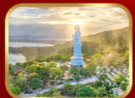
ขอพรกวนอิมวัดหลินอิ่ง