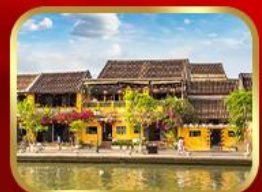
เที่ยวเมืองเก่าฮอยอัน