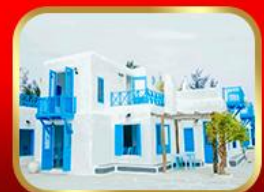
คาเฟ่ Son Tra Marina