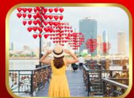
เช็กอินสะพานแห่งความรัก