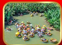
ล่องเรือกระดิ่งกัณฑ์