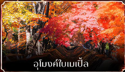
อุโมงค์ใบเมเปิ้ล