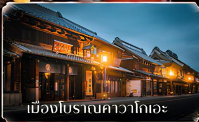
เมืองโบราณคาวาโกเอะ