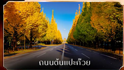
ถนนต้นแปะก๊วย