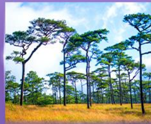
ลานสนภูสอยดาว