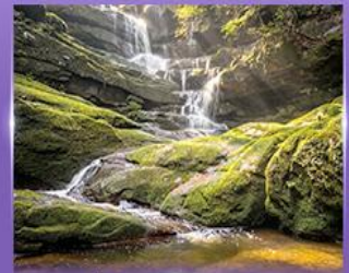
น้ำตกสายทิพย์