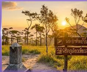
ชมพระอาทิตย์ขึ้น ภูสอยดาว