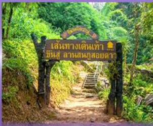
พีช 5 เป็นวัดใจ