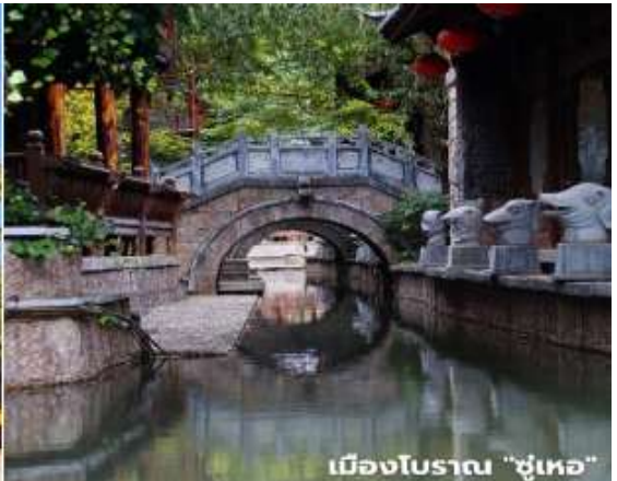
เมืองโบราณ "ชู่เหอ"