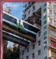
นั่งรถไฟทะลุติ๊ก 2 สถานี