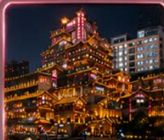
ชมแสงสีหงหยาดต้ง