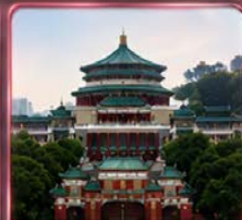
ศาลาประชาคม (ชมด้านนอก)