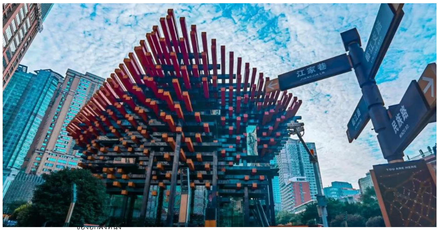
ของฮ้างหง

ภายในเป็นศูนย์รวมศิลปะสมัยใหม่ ที่มีโรงละคร ห้องจัดนิทรรศการ และแกลเลอรี จัดกิจกรรมศิลปะที่หลากหลายตลอดทั้งปี ดึงตะเกียบจึงไม่ได้เป็นแค่อาคาร แต่เป็นสัญลักษณ์ทางสถาปัตยกรรมที่ผสมผสานความดั้งเดิมเข้ากับความทันสมัยได้อย่างลงตัว สะท้อนถึงเอกลักษณ์ของเมืองฉงชิ่งได้เป็นอย่างดี