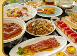
อาหารระดับ มิชลิน TAO TAO JU