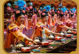
ภัตตาคารวังหลอง YU XIAN DU