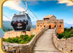
กำแพงเมืองจีน ด่านซือหม่าโต (รวมกระเช้า)