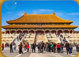
พระราชวังกู้กง THE FORBIDDEN CITY