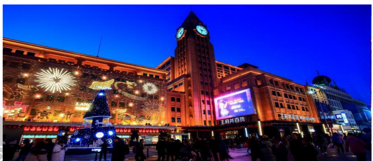
BW ปักกิ่ง เมืองโบราณคู่เป่ย์ส่วยเจิ้น 5D4N(Premium) by TG on Aug-Dec26-New Year26 อัปเดต 14-5-26

นำท่านเดินทางสู่ ถนนหวังฝูจิ่ง ถนนกลางคืนที่มีชื่อเสียงของปักกิ่ง นำท่านสัมผัสชีวิตและแสงสียามค่ำคืนของนครปักกิ่ง ตลาดถนนคนเดินทางแห่งกรุงปักกิ่งที่รวบรวมสินค้าอันหลากหลาย ไม่ว่าจะเป็นข้าวของเครื่องใช้ เสื้อผ้า และอาหารที่ขึ้นชื่อยอดนิยมของชาวจีน ไปจนถึงอาหารแปลกตาที่หารับประทานยาก ถือได้ว่าเป็นหนึ่งในเอกลักษณ์ และสีสันอันคึกคักของถนนหวังฝูจิ่ง โดยสถานที่ไฮไลท์ที่ห้ามพลาด ถนนอาหารแปลก เป็นตรอกเล็กๆ ที่เปิดเฉพาะช่วงกลางคืน มีสารพัด อาหารแปลกๆ มากมาย อาทิ ตะขาบ แมงป่อง ปลาดาว ม้าน้ำ หอยเม่น ซึ่งคนจีนเชื่อว่าเป็นอาหารที่บำรุงร่างกาย นอกจากนี้ ยังมีร้านขาย "ขนมปังถังหลู" ขนมหวานโบราณยอดนิยมของชาวจีนนั้นเองลงบันไดเลื่อนภายในห้างหวังฝูจิ่ง