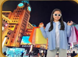
แหล่งช้อปปิ้งชื่อดัง WANGFUJING STREET