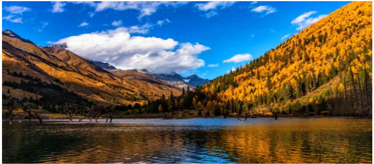
6. BIG PARADISE เสินตุ-สีตรึง-ต้ากุกลาเซียร์-จิวจ้ายโกว 6วัน5คืน (TG) on Aug – Dec 2026

นำท่านเที่ยวชม หุบเขาซวงเฉียวโกว หรือหุบเขาสะพานคู่ มีระยะทาง 34.8 กม. มีพื้นที่รวม 216 ตารางกิโลเมตร เป็นจุดวิวทิวทัศน์ที่สวยงามที่สุด ชมความงามธรรมชาติของซวงเฉียวโกว(ลำน้ำสองสะพาน) ธารน้ำมีความยาว 35 กิโลเมตร มีทิวทัศน์ของภูเขาเป็นหลัก ลำธารผ่านจุดต่างๆที่เป็นจุดทิวทัศน์ ไม่ว่าจะเป็น ชานกัวจวง,เขาหนิวซิน, เย่เหรินเฟิง ถือเป็นจุดท่องเที่ยวแห่งหนึ่งของเขาสีตรึงที่รวบรวมจุดสำคัญหลายๆอย่างเข้าด้วยกันไว้ ชมไฮไลท์จุดชมวิว โดยมีจุดท่องเที่ยวแบ่งออกเป็น 3 ส่วนด้วยกันหุบเขาหยิหยาง ล้อมรอบไปด้วยภูเขาทุกทิศทุกทาง ซึ่งอยู่ในส่วนที่ลึกที่สุดและจะได้เห็นธารน้ำแข็ง ภูเขากระจกแก้ว ภูเขาตวงอาทิตย์ ภูเขาตวงจันทร์ ยอดเขากระต่าย - ทุ่งหญ้าเหนียนหญูป้า ชมยอดเขารูปปร่างแปลกตา เช่น ยอดเขาพราน ยอดวังโปตาลา ยอดเขาเพชร - ภูเขาหญิงตั้งครรภ์ มีทิวทัศน์ที่สวยงามของท้องทุ่งกว้าง โดยมีฉากหลังเป็นภูเขาสูงปกคลุมด้วยหิมะขาว และในหุบเขาจะมีลำธารใสสะอาดรวมถึงต้นสนสูงสลัด้วยต้นไม้หลายหลากเฉดสี เช่น เขียวอ่อน เขียวแก่