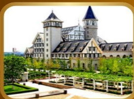
คฤหาสน์นางจิ้งจอก