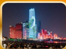
NO. 3 BATHING BEACH LIGHT SHOW