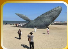
ประติมากรรมวาฬเกยตื้น