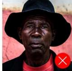
Back side is colored