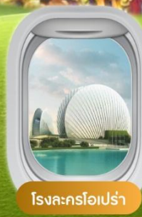
โรงละครโอเปร่า