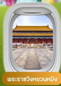
พระราชวังหยวนหมิง