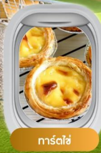
การ์ดไข่