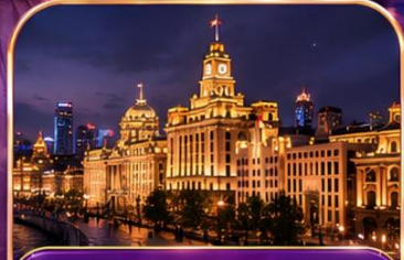
THE BUND วิวสุดโรแมนติก ริมน้ำหวงผู่