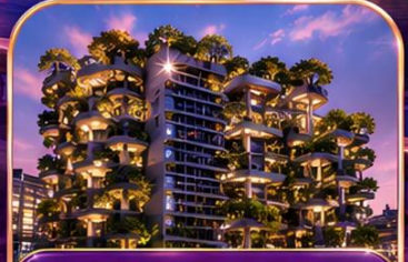
TIAN AN 1,000 TREES อาคารต้นไม้พันต้นสุดไวรัล