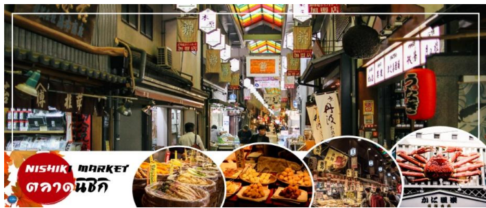
NISHIKI MARKET ตลาดนชิกิ

นำท่านสู่ ตลาดนชิกิ (Nishiki Market) ตลาดเก่าแก่ใจกลางเมืองเกียวโตที่ได้รับฉายาว่า “ครัวแห่งเกียวโต” เพลิดเพลินกับบรรยากาศถนนสายอาหารชื่อดังที่เต็มไปด้วยร้านค้ากว่า 100 ร้าน ทั้งอาหารพื้นเมือง ขนมญี่ปุ่น ของฝาก และวัตถุดิบท้องถิ่นขึ้นชื่อ ให้ทุกท่านได้ลิ้มลองเสน่ห์แห่งวัฒนธรรมการกินแบบเกียวโตอย่างแท้จริง และยังสามารถเลือกซื้อสินค้าท้องถิ่น เช่น ผัก ผลไม้ของเกษตรกรท้องถิ่น ฯลฯ ที่มีให้เลือกอย่างหลากหลาย