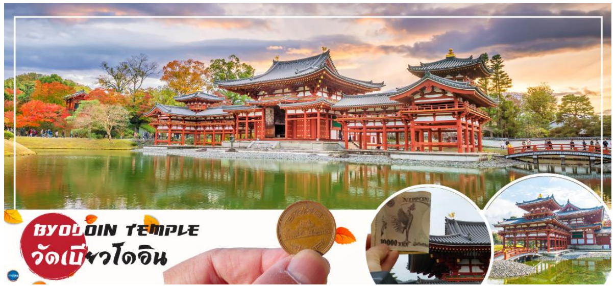
BYODOIN TEMPLE วัดเบียวโดอิน

00.55 น. ออกเดินทางสู่ เมืองโอซาก้า ประเทศญี่ปุ่น โดยเที่ยวบินที่ XJ612 สายการบิน AIR ASIA X ใช้เครื่อง AIRBUS A330-300 จำนวน 377 ที่นั่ง จัดที่นั่งแบบ 3-3-3 (น้ำหนักกระเป๋า 20 กก./ท่าน หากต้องการซื้อน้ำหนักเพิ่ม ต้องเสียค่าใช้จ่าย)