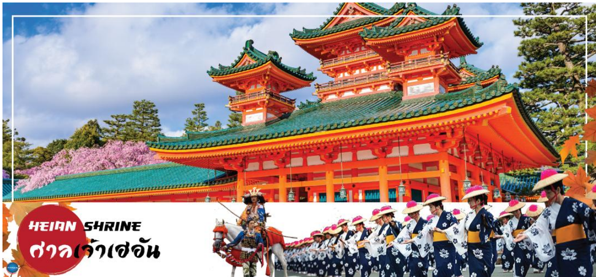
HEIAN SHRINE ศาลเจ้าเฮอัน

วันที่สี่ เมืองนาโกย่า – เมืองเกียวโต – ศาลเจ้าเฮอัน – การเรียนพิธีชงชาญี่ปุ่น – ตลาดนชิกิ – เมืองโอซาก้า – ช้อปปิ้งชินไซบาชิ