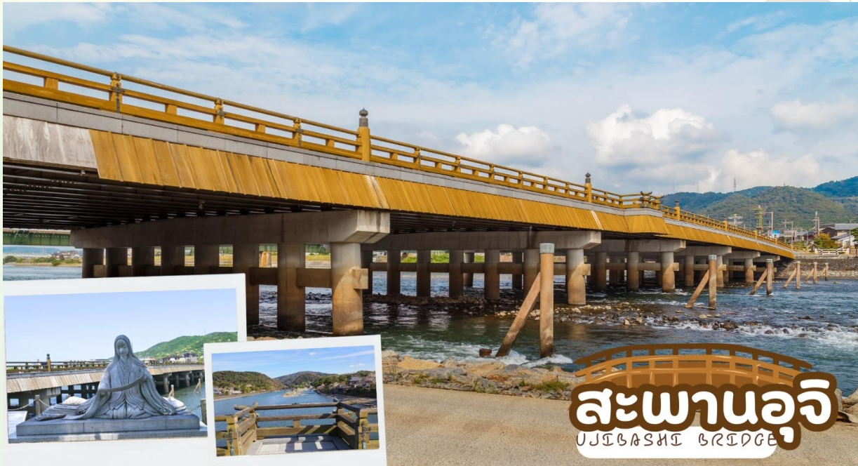
GO2KIX-TG097 – OSAKA FUJI TOKYO YOKOHAMA KAMAKURA 6D 4N BY [TG]

ถนนชาเขียว เบียวโดอิน โอโมเตะซันโด (Byodo-in Omotesando) ตลอดสองข้างทางเต็มไปด้วยร้านขนม ร้านอาหาร และคาเฟ่น่ารักๆ รวมไปถึงร้านของฝาก ที่เกือบทั้งหมดทำมาจากอูจิมัทฉะ ไม่ว่าจะเป็นชอฟูครีมอูจิมัทฉะ โซบะอูจิมัทฉะ ราเม็งอูจิมัทฉะ เกียวซ่าอูจิมัทฉะ ทาโกะยากิอูจิมัทฉะ และยังมีเมนูอื่นๆอีกมากมายที่น่าลิ้มลองตลอดสองข้างทาง ให้ท่านได้แวะชิมรสชาเขียวอูจิดันตำรับและยังมีขนมที่ทำจากอูจิมัทฉะให้ซื้อกลับไปเป็นของฝากด้วย