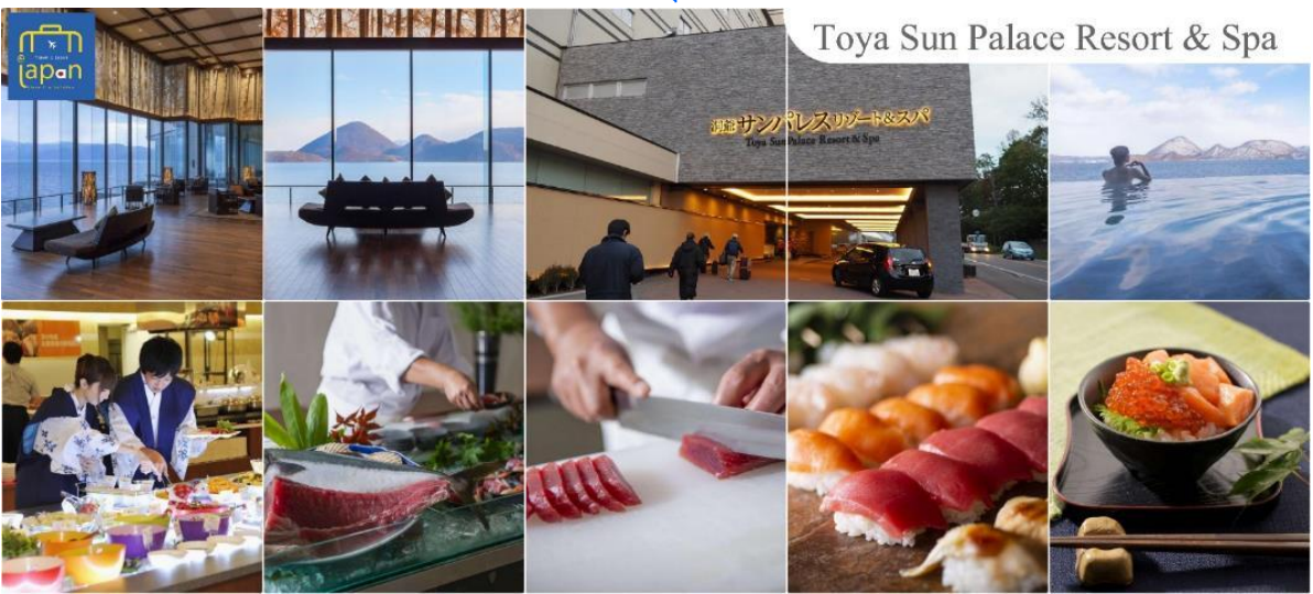
Toya Sun Palace Resort & Spa

ที่พัก TOYA SUN PALACE RESORT & SPA หรือเทียบเท่าระดับเดียวกัน ค่า รับประทานอาหารค่ำ ณ ภัตตาคาร ของโรงแรม (4) --หลังอาหารให้ท่านได้ผ่อนคลายกับการแช่น้ำแร่ธรรมชาติ เชื่อว่าถ้าได้แช่น้ำแร่แล้ว จะทำให้ผิวพรรณสวยงามและช่วยให้ระบบหมุนเวียนโลหิตดีขึ้น--