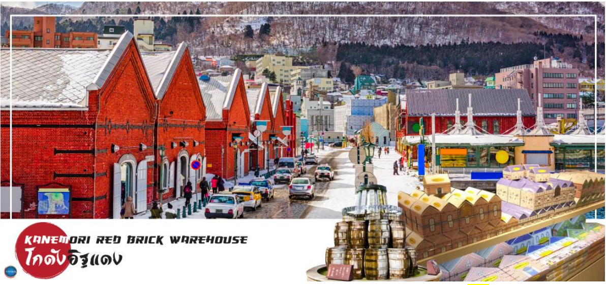
KANEMORI RED BRICK WAREHOUSE โกดังอิฐแดง

วันที่สาม เมืองฮาโกดาเตะ – ตลาดเช้าฮาโกดาเตะ – โกดังอิฐแดง – ย่านเมืองเก่าโมโตมาชิ – ป้อมโกเรียวกาคู (เข้าชม) – ทะเลสาบโทยะ – ออนเซน